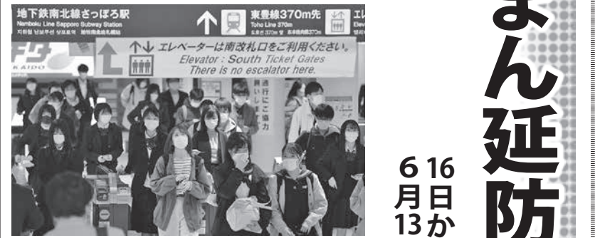
札幌市営地下鉄さっぽろ駅の改札を通るマスク姿の人たち。北海道では新型コロナウイルス感染者数が過去最多の700人を超えた。13日午後（共同）

まん延防止5県追加へ 6月13日 群馬、岡山、熊本など 【共同】政府は13日、まん延防止等重点措置の対象に群馬、石川、岡山、広島、熊本を追加する方針を固めた。追加する方針を固めた。追加する方針を固めた。