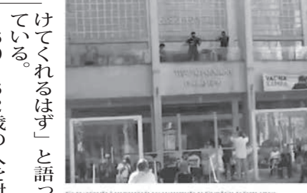
Fila da vacinação é acompanhada por apresentação da Filarmônica de Santo Amaro em posto de imunização da Zona Sul de SP

前11時。劇場の入り口前に立つ指揮者がタクトを振ると、劇場外部の回廊に陣取っていたサントアマロ・フィルハーモニー・オーケストラ(O.F.I.S.A.)の面々が演奏を始めた。演奏時間は約15分間で、映画の音楽や、映画の音楽をアレンジした曲が演奏された。O.F.I.S.A.の指揮者のシルヴィア・ルイザ・ダ氏は、「音楽には人々の心を新たなエネルギー