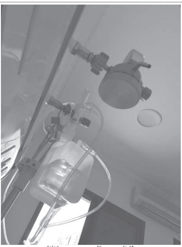
病室のベッドから仰ぎみる点滴