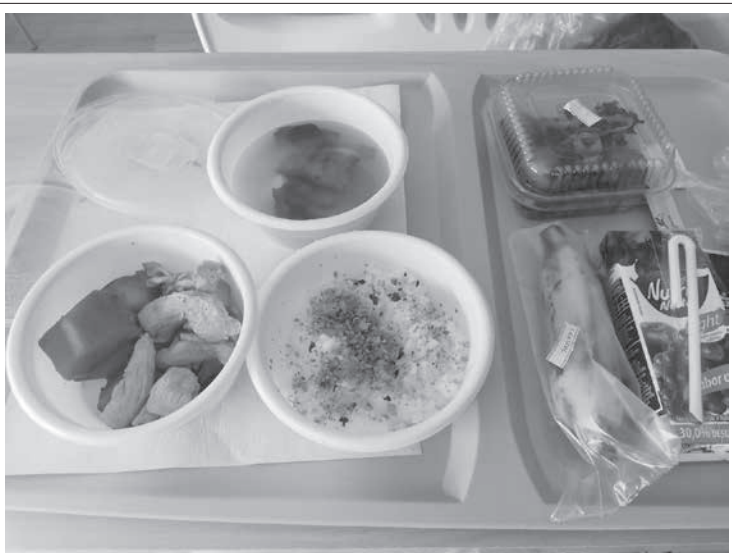
入院中の食事は日本食。弱っている時には特にありがたい