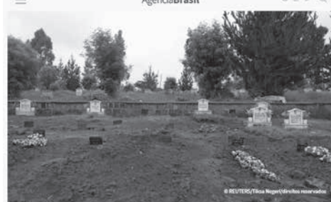
Óbitos no Rio de Janeiro em abril foram maiores que nascimentos Dados preliminares são do Portal da Transparência do Registro Civil リオ州で人口減少が起きたと報じる4日付アジェンシア・ブラジルの記事の一部

だが、パンデミックが始まってからは出生者数が減って死者数が増え、死者数が出生者数を上回る事さえ起き始めた。リオ州で最初に人口減少が起きたのは昨年5月で、死者が出生者より335人上回った。同様の動きは昨年12月にも起き、死者が出生者より2897人上回った。人口減少はリオ州の方向性が顕著だ。4月の場合、出生者は4936人、死者は6331人で、8回目を人口減少が起きた。同市でもパンデミック前の昨年1月は出生者が死者の1万9961人を上回った。