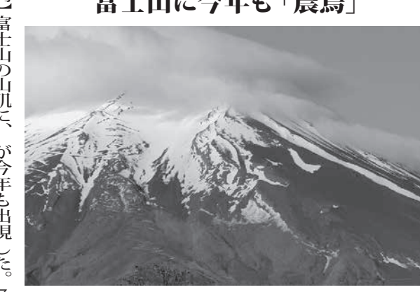
富士山の山肌に現れた「農鳥」（中央右）＝18日午前

【共同】富士山の山肌に、今年も「農鳥」が出現した。農鳥は、農作業の忙しさを象徴する鳥で、富士山の山肌に出現すると、農作業が盛況になると言われている。農鳥は、農作業の忙しさを象徴する鳥で、富士山の山肌に出現すると、農作業が盛況になると言われている。