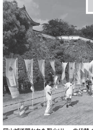
岡山で開かれた聖火リレーの代替イベントで炎をつなぐランナー。19日午後、岡山市

【ロサンゼルス共同】米有力紙ロサンゼルス・タイムズが、東京五輪の開催が危ぶまれていると報じた。米有力紙ロサンゼルス・タイムズが、東京五輪の開催が危ぶまれていると報じた。