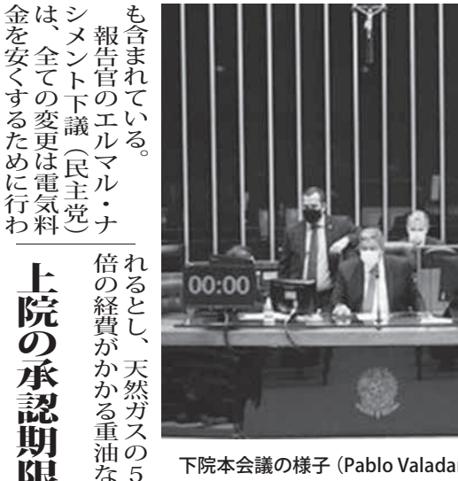
下院本会議の様子

下院が19日、エレクトロブラスの民営化のための暫定令(MP1031/21)を313対166で承認し、19と20日付伯字サイトに報じた。エレクトロブラスは国内で供給される電力の3分の1を担っており、現政府が掲げる公社民営化の目玉だ。2月23日付官報に掲載されたMPの法令には上下両院での承認が必要で、今後は上院で審議されることになる。 エレクトロブラスの株式の60%は国が所有しており、経営権も国にある。民営化後の国の所有株式は40%になるが、これらの株式は「ゴールデンシェア」と呼ばれる特別優先株で、定款に関する審議では拒否権が使える。また、民営化後も人やグループの株主に認められる株式所有率は最大で10%だから、国が最大株主である点は変わらない。残りの株式は公開売却される。 当初は「民営化のための条件」として、入札前に送られなければならない複数が、MPの有効期間である6月22日までに上院でも承認を得るための事前協議の中で遂行不能と判断され、「国が順守すべき項目」と言い換えられた。国が順守すべき項目の一つは、天然ガスを活用した火力発電による電力の