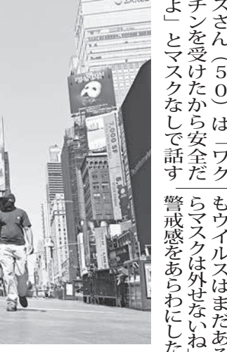
人出が戻りつつある米ニューヨークの繁華街、タイムズスクエア

【ニューヨーク共同】代表的暗号資産(仮想通貨)であるビットコインの価格が19日の取引で急落した。調査会社コインデスクによると、一時、ビットコインは3万2000ドル(約330万円)となり、4月14日に付けた最高値の6万4000ドル超の半値以下に落ち込んだ。中国で金融機関に仮想通貨の関連業務を禁じる通知が出されたことが引き金となった。