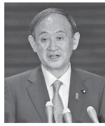
菅首相の緊急事態宣言について話した菅首相。20日午後7時58分、首相官邸。

菅義偉首相は20日夜、新型コロナウイルス緊急事態宣言への対応を巡り関係閣僚と官邸で協議し、沖縄県の適用対象追加を21日に専門家に諮る方針を明らかにした。