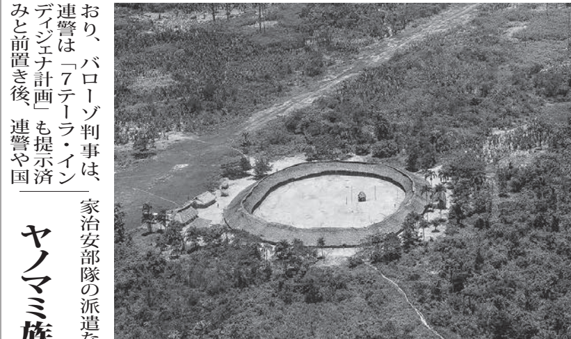
ヤノマミ族の集落の一つ (Terra Indígena Yanomami/Leonardo Prado/PG/FotosPúblicas(2015))

また、ムンドウルク族の居住地での不法伐採と違法木材輸出問題では、連警が19日に、リカルド・サレス環境相や国立再生可能天然資源・環境院(Ibama)の院長らも含めた公職者の汚職を視野に入れた「アクア・ドゥ・パズ」を敢行した。同作戦直後、米国の輸出許可証がない木材が含まれていたと通達している。また、連邦政府は、先住民の権利擁護が確認された。司法当局は既に連邦政府に対して侵入者隔離計画を提出する事を命じており、バロゾ判事は、連警は「7テラ・イン・デザイン計画」も提示済みと前置き後、連警や国