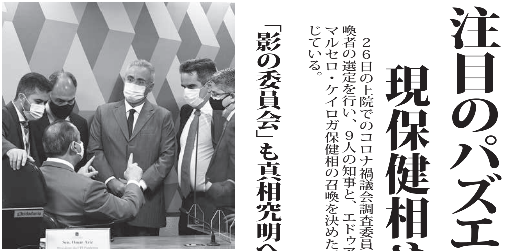
26日のCPI

26日の上院でのコロナ禍調査委員会(CPI)では今後の召喚者の選定を行い、9人の知事と、エドゥアルド・パズエロ保健相、マルセロ・ケイロガ保健相の召喚を決めた。26日付伯字サイトが報じている。