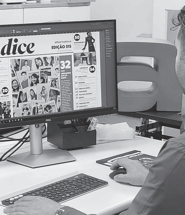
日本で生活するブラジル人に役立つ情報を発信し続けている編集部スタッフ

会社概要 【会社設立年】2001年 【創刊年月】2001年5月24日 【社名】有限会社 日伯友愛