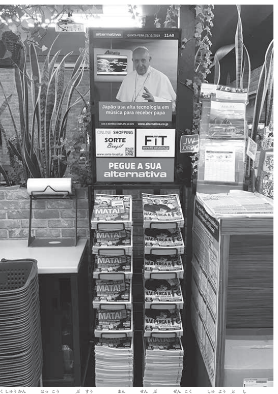
隔週刊の発行で部数は1万8千部、全国の主要都市300カ所で販売されている