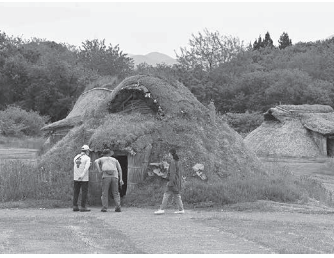
世界文化遺産への登録勧告された三内丸山遺跡＝27日午前、青森市（共同）

【共同】北海道・北東北の縄文遺跡群（北海道、青森、岩手、秋田）の世界文化遺産への登録勧告が、あきつ、縄文服に見立てた衣装に身を包んだボランティアらによって、この夏、世界遺産へ」と書かれた横断幕の前で万歳を繰り返した。