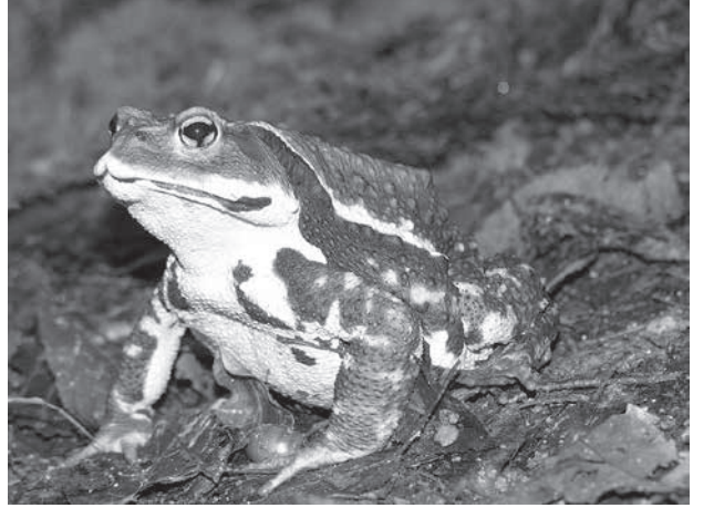
ニホンヒキガエル (通称「ガマ」)