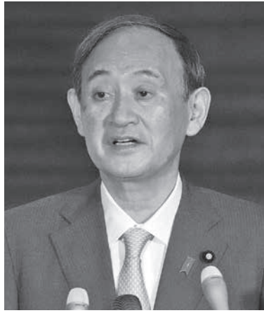
新型コロナウイルス対応の関係閣僚と菅首相は27日午後、首相官邸

【共同】政府は、新型コロナウイルス対応の改正特別措置法に基づき、東京、大阪など9都道府県に発令している緊急事態宣言の31日までの期限を6月20日まで延長する方針を固めた。