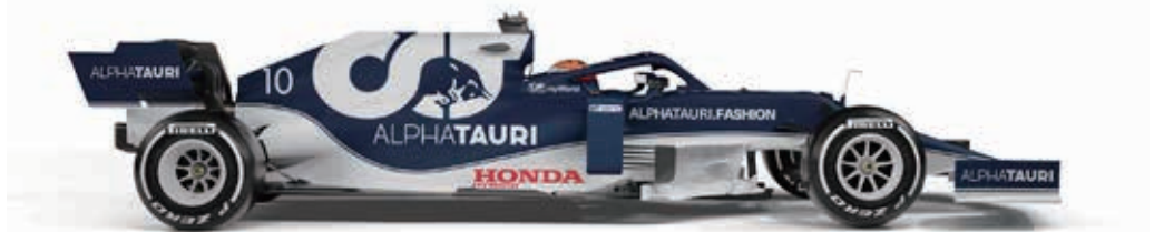
O francês Pierre Gasly da AlphaTauri Honda terminou na terceira posição.

今後のレース: Próximas Corridas: GP da França: 20 de junho 2021. GP da Áustria: 27 de junho 2021.