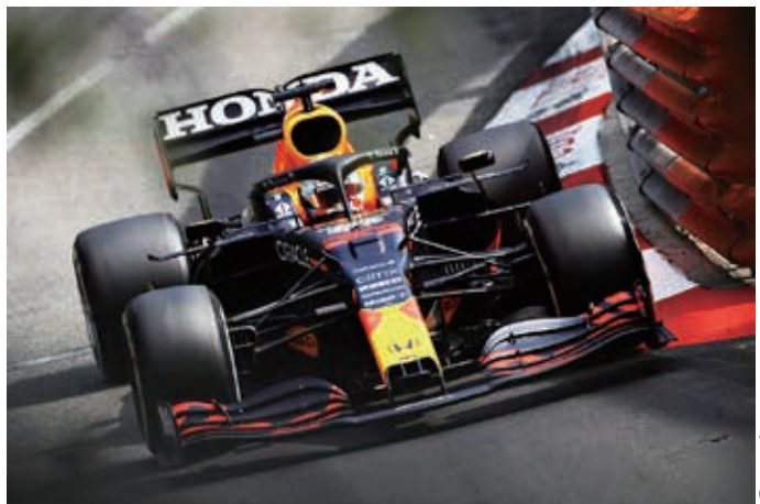
Max Verstappen venceu o GP de Mônaco há duas semanas.

リのモノコクドライバー、シャルル・ルクレールが数周リードしていたが、2 周目にハミルトンに、6 周目にフェルスタッペンに抜かれた。8 周目、ストレートでセルジオ・ペレスがフェラーリを追い抜いた。レッドブル・ホンダは、マックス・フェルスタッペンとペレスの首位独占を目指していた。フェルスタッペンはポイントを獲得できなかったが、ドライバーズチャンピオンシップのリードを維持している。