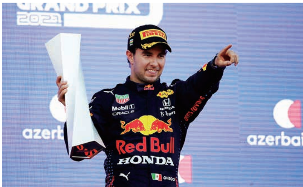
Sergio Perez conquistou a sua segunda vitória na F-1.

レッドブル・ホンダのメキシコ人ドライバー、セルジオ・ペレス (31) がアゼルバイジャン GP で勝利を収めた。レースの大部分をリードしていたオランダ人ドライバーのマックス・フェルスタッペンが 46 周目