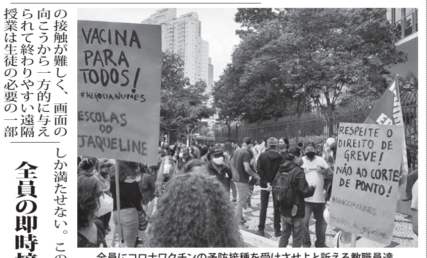
全員にコロナワクチンの予防接種を受けさせよと訴える教職員連

授業制限の直撃を受ける子どもも 新型コロナウイルスへの感染を恐れ、対面授業が始まって子どもを学校に行かせないという親も多いため、学校の活動も制限されている。影響は幼児や年少者ほど大きいとの報告がなされた。7、8日付の紙、サイトに報じた。