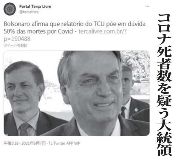
7日のボルソナロ大統領

選挙時の違法献金も発覚 週末から週明けにかけて、ファイザー製薬のワクチンに関する手紙無視、大統領選挙の際の不正疑惑、虚偽報告など、ボルソナロ大統領にまつわる疑惑が次々と浮上した。7、8日付の紙、サイトに報じている。