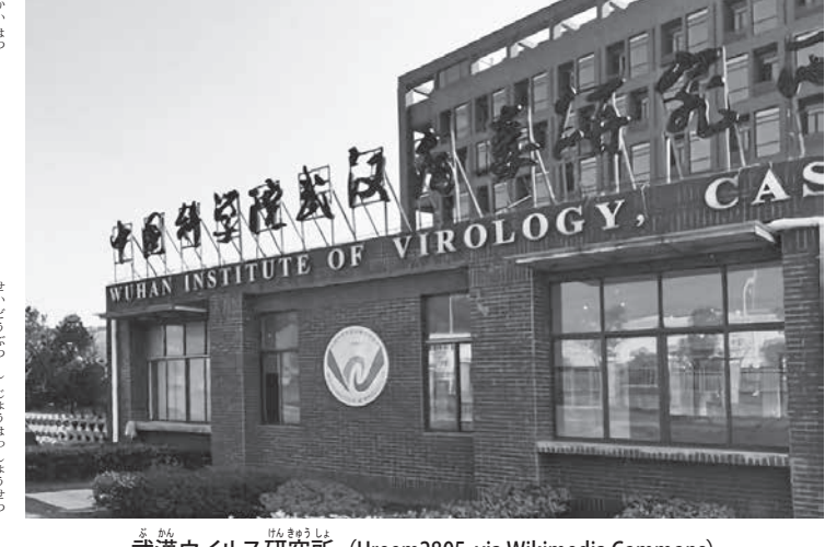
武漢ウイルス研究所

「武漢ラボは米中共同開発の生物兵器漏洩説」が、もともと中国で研究されていたが、この種の研究を禁止する危険性の高いものだと見られるようになった。 「武漢ラボは米中共同開発の生物兵器漏洩説」が、もともと中国で研究されていたが、この種の研究を禁止する危険性の高いものだと見られるようになった。 「武漢ラボは米中共同開発の生物兵器漏洩説」が、もともと中国で研究されていたが、この種の研究を禁止する危険性の高いものだと見られるようになった。