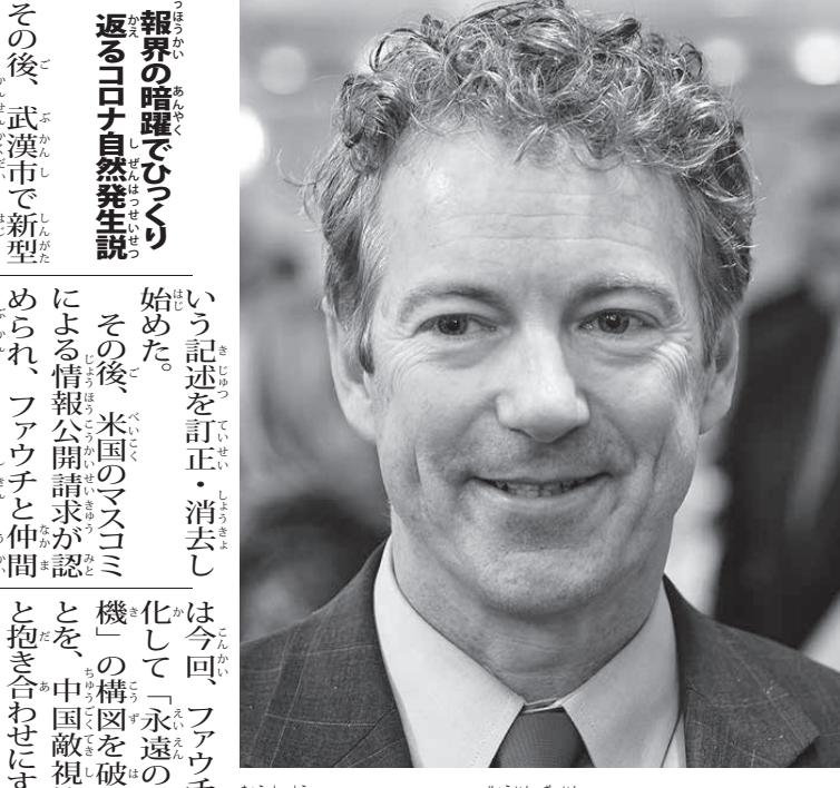
共和党のランド・ポール上院議員

「武漢ラボは米中共同開発の生物兵器漏洩説」が、もともと中国で研究されていたが、この種の研究を禁止する危険性の高いものだと見られるようになった。 「武漢ラボは米中共同開発の生物兵器漏洩説」が、もともと中国で研究されていたが、この種の研究を禁止する危険性の高いものだと見られるようになった。 「武漢ラボは米中共同開発の生物兵器漏洩説」が、もともと中国で研究されていたが、この種の研究を禁止する危険性の高いものだと見られるようになった。