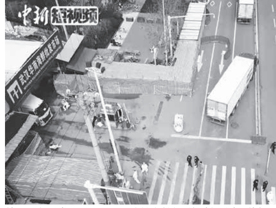
当初、発生源とされていた武漢市南海鮮卸売市場の空撮。左手に見えるのが正面玄関。消毒チームが付近の消毒を行っている(2020年3月4日撮影)

「武漢ラボは米中共同開発の生物兵器漏洩説」が、もともと中国で研究されていたが、この種の研究を禁止する危険性の高いものだと見られるようになった。 「武漢ラボは米中共同開発の生物兵器漏洩説」が、もともと中国で研究されていたが、この種の研究を禁止する危険性の高いものだと見られるようになった。 「武漢ラボは米中共同開発の生物兵器漏洩説」が、もともと中国で研究されていたが、この種の研究を禁止する危険性の高いものだと見られるようになった。