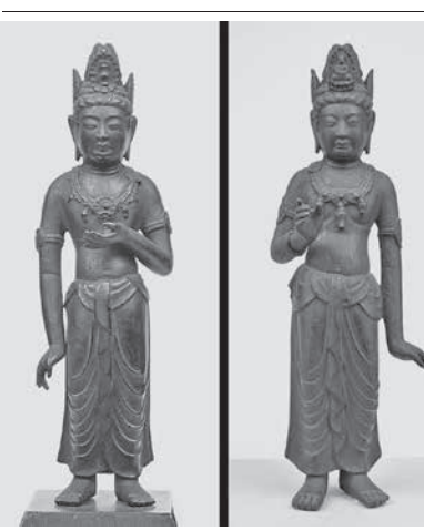
京都府在住の個人が所有していた銅造勢至菩薩立像(左)と真光寺所蔵の銅造観音菩薩立像

【共同】大津市歴史博物館は9日、真光寺(同市下坂本)が所蔵する銅造観音菩薩立像(奈良時代)と、重要文化財として指定された銅造勢至菩薩立像(鎌倉時代)の再会を報告した。両像は江戸時代初期から明治にかけて、京都の某屋敷にあり、その後、大津市に持ち込まれたと推定されている。