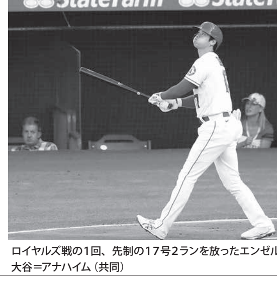
ロイヤルズ戦の1回、先制の17号2ランを放ったエンゼルス・大谷=アナハイム

「武漢ラボは米中共同開発の生物兵器漏洩説」が、もともと中国で研究されていたが、この種の研究を禁止する危険性の高いものだと見られるようになった。 「武漢ラボは米中共同開発の生物兵器漏洩説」が、もともと中国で研究されていたが、この種の研究を禁止する危険性の高いものだと見られるようになった。 「武漢ラボは米中共同開発の生物兵器漏洩説」が、もともと中国で研究されていたが、この種の研究を禁止する危険性の高いものだと見られるようになった。