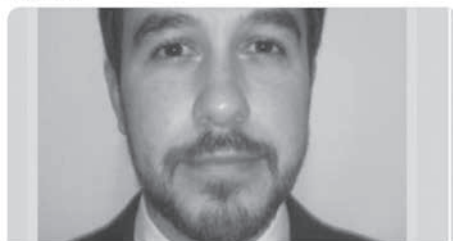
Auditor do TCU confessa que pai militar repassou dados falsos a Bolsonaro e...