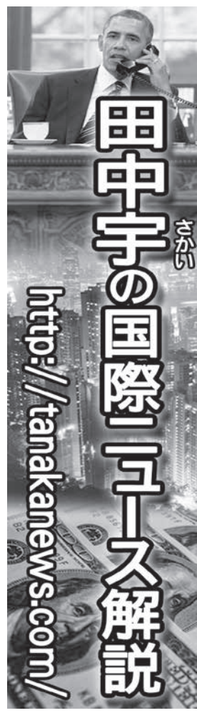
田中宇の国際ニュース解説 http://tanakanews.com/ 6月4日版