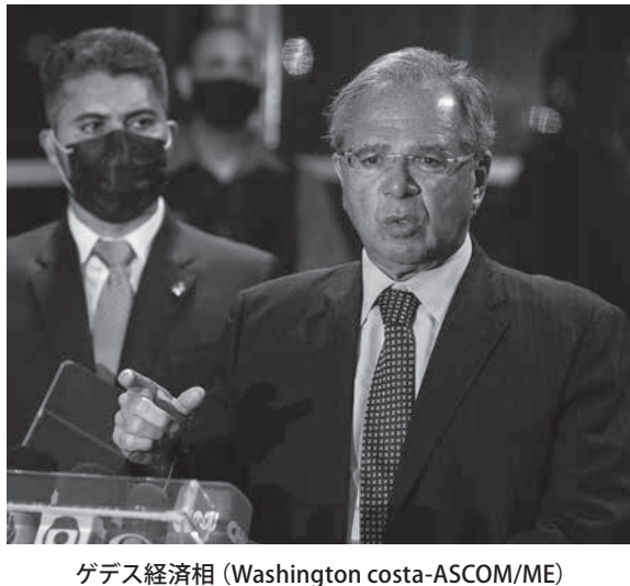
ゲデス経済相 (Washington costa-ASCOM/ME)