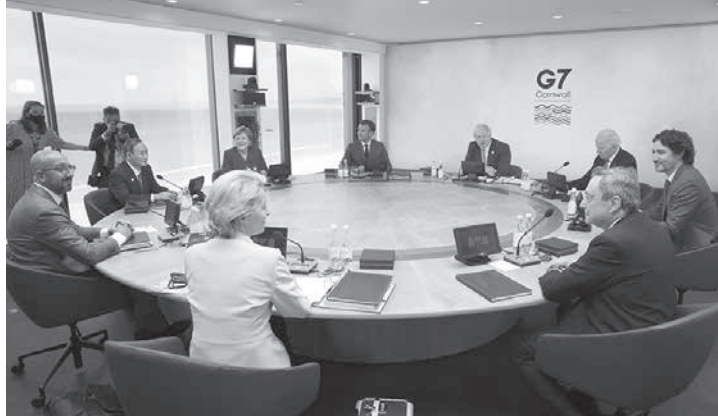
G7サミットで初日の討議に臨む (左端から時計回りに) ミシェルEU大統領、菅首相、ドイツのメルケル首相、フランスのマクロン大統領、英国のジョンソン首相、バイデン米大統領、カナダのトルドー首相、イタリアのドラギ首相、フォンデアライエン欧州委員長=11日、英コーンウォール