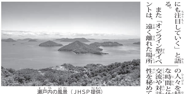
瀬戸内の風景

サンパウロ市のジャパンハウス(JHSP)エリック・アレシアンダレ・クルツク館長は旅行感覚を味わえるオンライン体験イベントシリーズを企画。第1弾となる「せとうち訪問」を7月1日午後7時に開催する。 「芸術と自然が調和している場所」として日本で唯一、ニューヨーク・タイムズ紙「2019年に行くべき世界の52の場所」にも選ばれた「せとうち」を巡り、各地の見所や地域の工芸、祭りやおもてなし文化を浮き彫りにしていく。 第1弾となる「せとうち訪問」では、瀬戸内海東部に位置する岡山県、兵庫、香川、徳島、鳥取の4県を紹介。同企画は、日本の各地域が持つ多様性を、自然や景観だけでなく、食や暮らし、歴史や文化、現