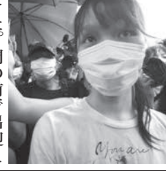
周庭氏(右)が、香港の裁判所を出所した。

【香港共同】2019年6月の香港警察本部包囲デモを巡り、昨年12月に無許可集会煽動罪などで禁錮10月の実刑判決を受けた、周庭氏(24)が12日、出所した。関係者によると、模範囚として刑期を短縮された。ただ昨年8月に香港国家安全維持法(国安法)違反の疑いで逮捕された周氏は、今後、同法違反で起訴される可能性があるという。