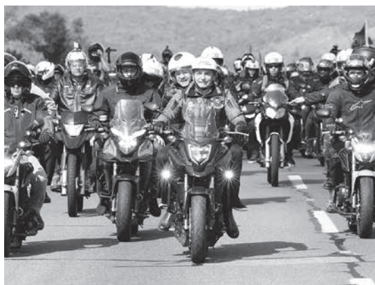
トシアツタでのボルソナロ大統領