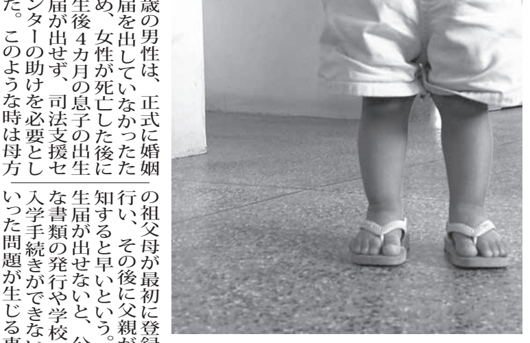
コロナ禍の長期化で増えているコロナ孤児 (TVBrasil)

生活扶助の見直しと共に 連邦政府が生活扶助(ボルサ・ファミリア)の見直しに合わせ、コロナ禍で家計の責任者である親を失った子供達への特別支援を考えていると15日付のウェブサイト紙などが報じた。 連邦政府が検討中のコロナ孤児支援策は、コロナ感染症で親や扶養責任者を失った子供達が18歳になるまで、月額240〜250レアルを支給するというもの。現行の生活扶助の基準では子供達の追加支給は「登録システム(カダストロ・ウニコ)」を基に