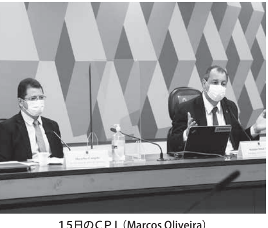
15日のCPI (Marcos Oliveira)

CPIで深まった女隊長の疑惑 外務省が、すでに「効用がない」との研究結果が出た後もインドの企業3社にクロッキンを求めたことや、連邦政府がファイザー製薬のワクチンの返事に2カ月かかっていたところから、クロッキンだと15分程度で返答を行っていたことが明らかになった。さらに、上院のコロナ禍の議会調査委員会(CPI)では15日、アマゾン州の保健局長が、「保健省はクロッキンによる早期治療を求め、同業を送ってきた」との発言も行われた。12〜15日付の日報、サイトが報じている。