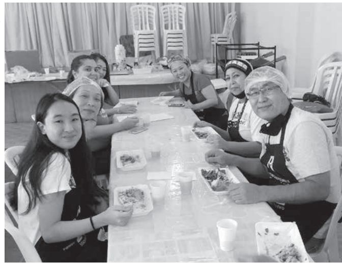
ボランティアスタッフの方々

「63歳(三世)はそう汗を拭いながら笑顔で語った。6月6日に本年二回目の持ち帰りイベント「SUSHIEN」を開催した。