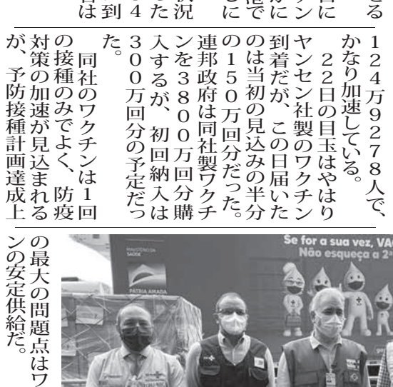
ヤンセン社製のワクチンの受け渡しに立ち会ったケイロガ保健相 (中央、Ministerio da Saude)

最大の課題はワクチンの安定供給だ。ヤンセン社製が予定の半分だった事からも分かる。