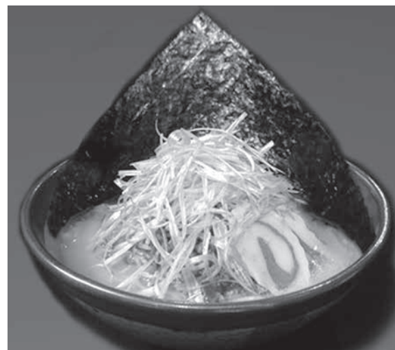
江戸味噌 肉ネギラーメン

「野菜ラーメン」のどれかを注文する。辛味を強調した「味噌ラーメン」に加え、「味噌唐揚げ丼」や「甘辛味噌ラーメン」など、20種類以上のメニューを揃えている。