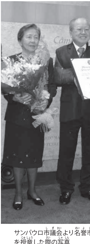
サンパウロ市議会より名誉市民章を授章した際の写真

1989年53歳、1月7日の昭和天皇崩御に際し、ブラジル公式代表として7人の1人として昭和天皇「大喪の礼」2月24日に参列した。1978年、春の叙勲で「旭日中綬章」を受章した。