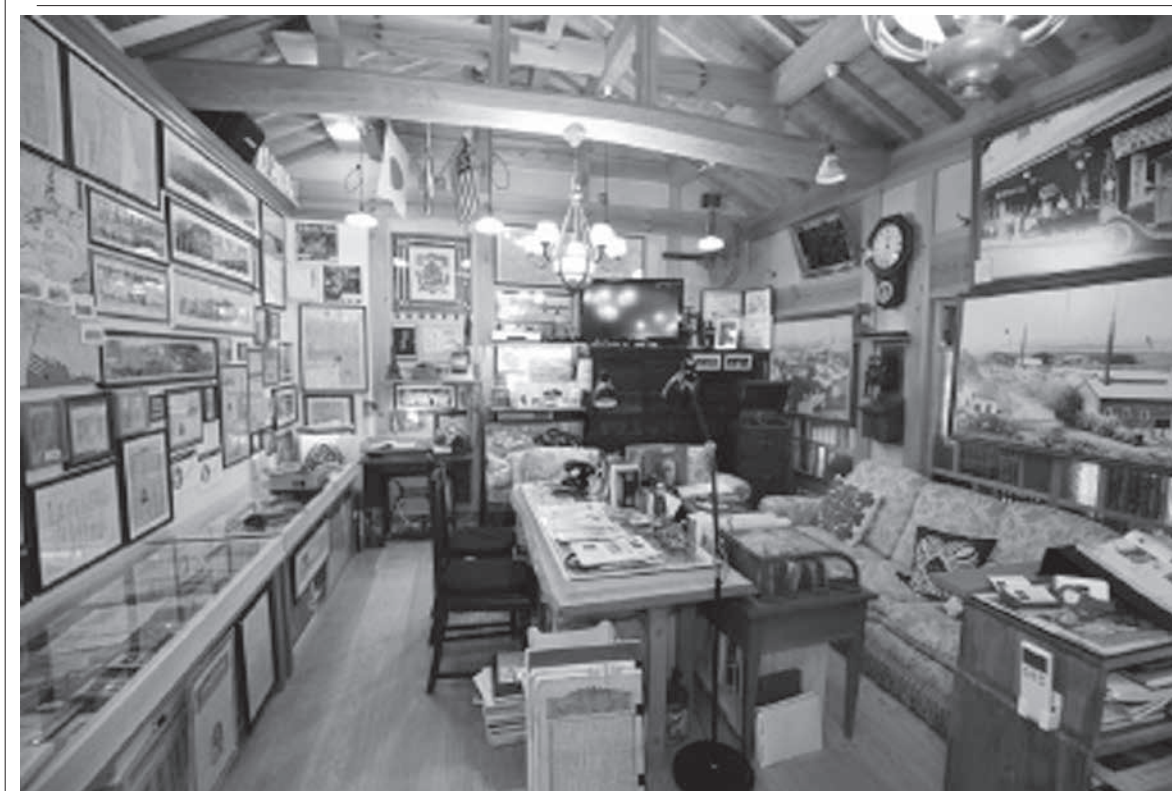
ハワイ移民史料館仁保島村の写真