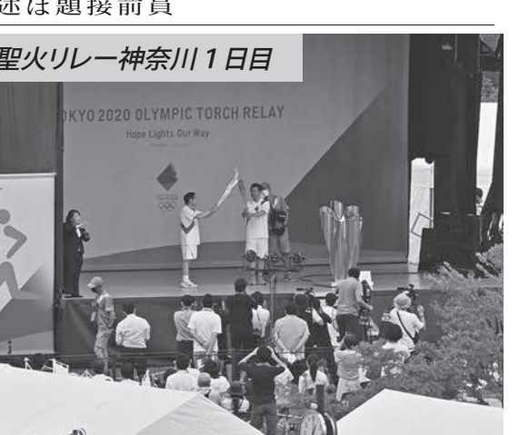
公道での聖火リレーが中止となり、トーチキス方式で実施された代替イベント。28日午後、神奈川県藤沢市

【共同】秋までに実施される衆院選の前哨戦となる東京都議選（7月4日投開票、定数127）について、共同通信社は25日、都内の有権者約2千人に電話世論調査を実施した。投票先は自民党が最多で3割を占め、第1党を奪還する勢い、小池公明が知事特別顧問を務める地域政党「都民ファースト」の支持も高まっている。