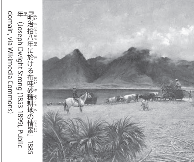
「明治拾八年に於ける布哇砂糖耕地の情景」1885年