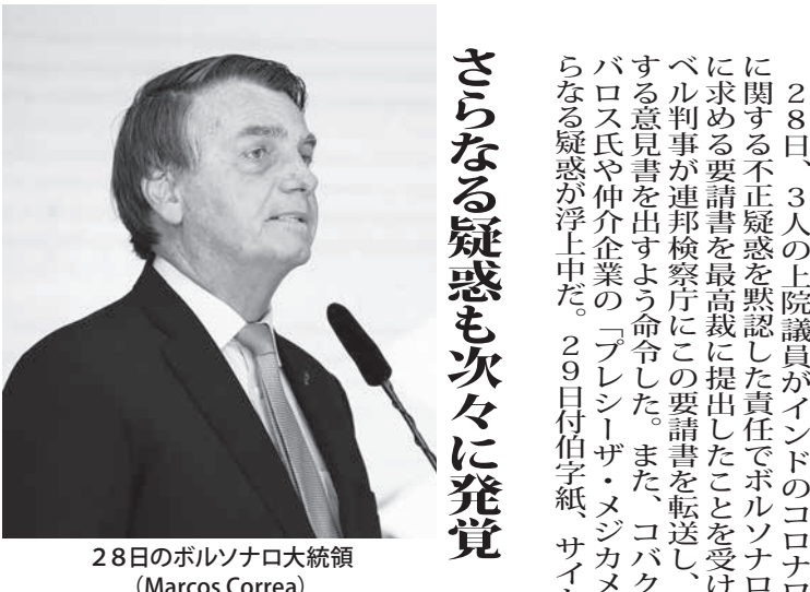
28日のボルソナロ大統領 (Marcos Correa)

28日、3人の上院議員がインダのコロナワクチン「コバクシン」に関する不正疑惑を黙認した責任でボルソナロ大統領を捜査するよう求める要請書を最高裁に提出したことを受け、同裁のロウザ・ウエベル判事が連邦検察庁にこの要請書を転送し、犯罪性の有無などに関する意見書を出すよう命じた。また、コバクシン疑惑の渦中にあるバロス氏や仲介企業の「プレジザー・メジカメント」についてもさらなる疑惑が浮上中だ。29日付付字紙「サイト」が報じている。