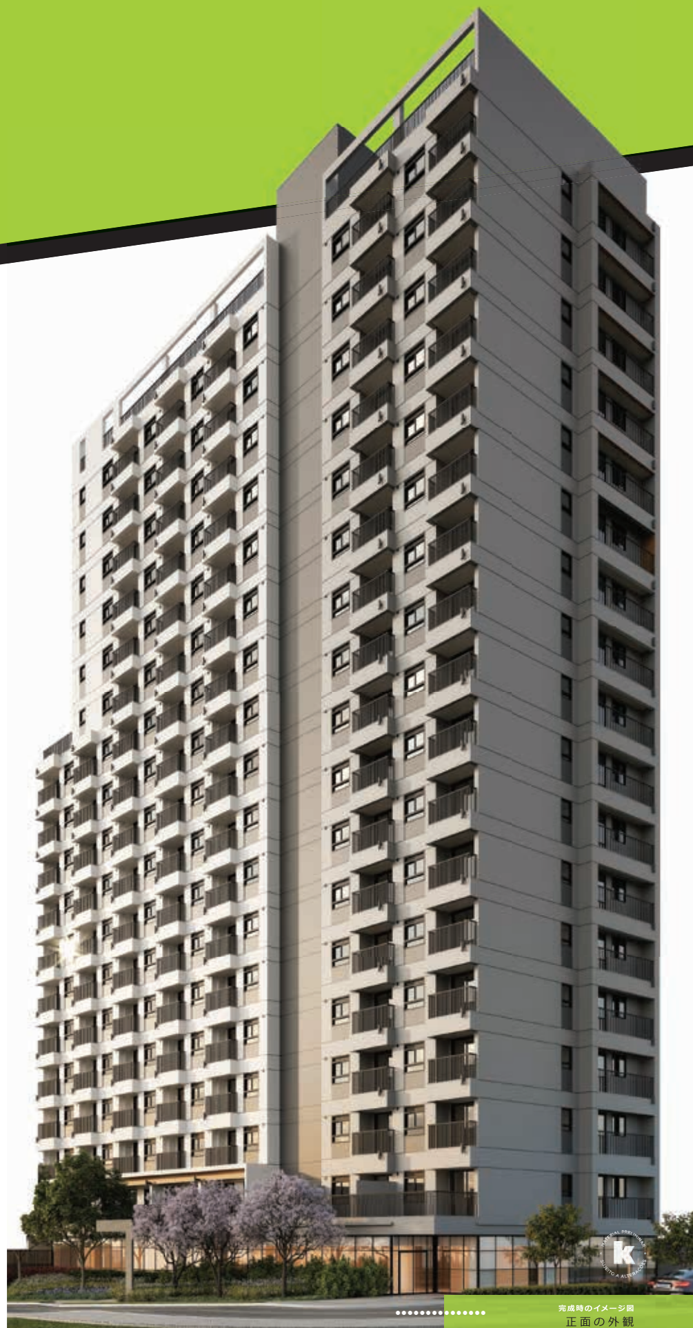
完成時のイメージ図 正面の外観