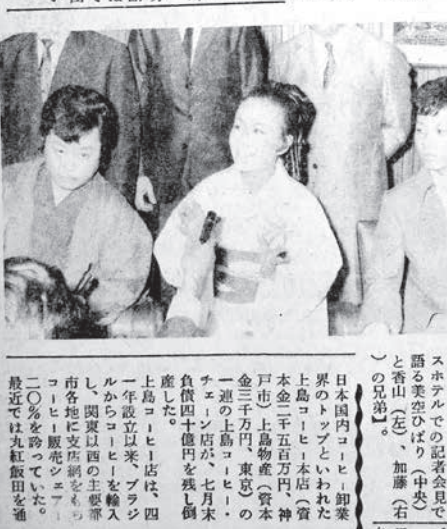
美空ひばり一行の到着を報じる1980年8月7日付パワリスタ新聞

「美空ひばり」の着聖。美空ひばりが6日空路東京へ。美空ひばりが6日空路東京へ。美空ひばりが6日空路東京へ。