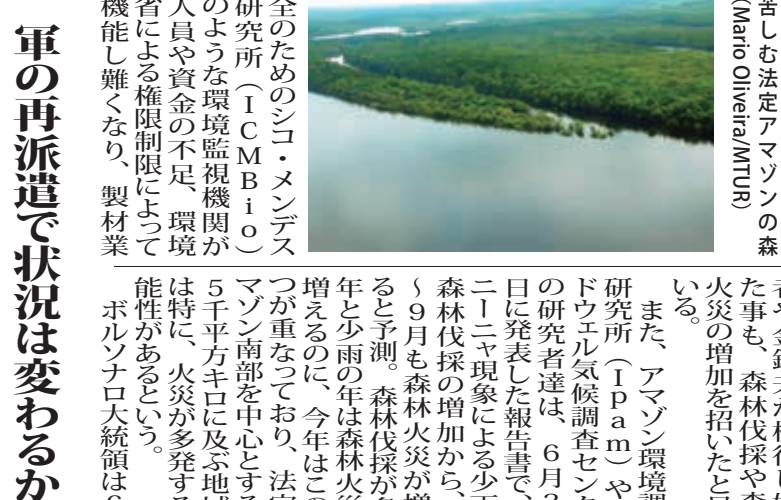
火災、伐採 大々々と進むアマゾンの森

アマゾンでは、6月に2308件の森林火災が起きたと発表。これは、2019年以降で最も多いと見られる。アマゾンでは、6月2日付付字紙が報じた。