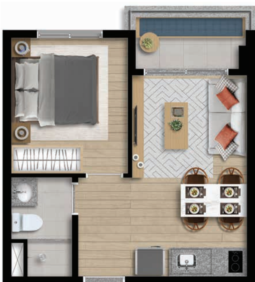
29平米の物件の場合のイメージ図。家具や調度品類は、不動産販売の契約には入っていません。壁面から壁面までの計算です。内装は覚書に書かれた通りに引き渡されます。