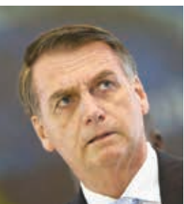
ボリソナロ大統領 (Marcos Camargo)