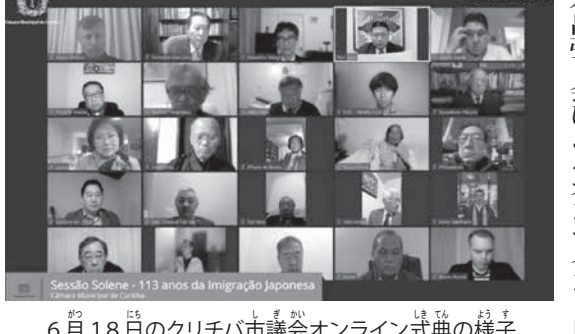
6月18日のクリチバ市議会オンライン式典の様子

パナチ州のロンドリーナ市議会が6月17日、クリチバ市議会が18日、「日本人移住の日」を記念したオンライン式典を開催された。22日には国際日系デーの記念式典が開催されるなど、連日オンラインで移民の日や日系デーが祝われた。