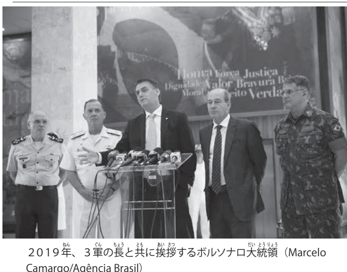
2019年、3軍の長と共に挨拶するボルソナロ大統領