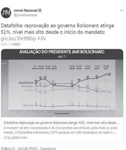
Datafolha: reprovação ao governo Bolsonaro atinge 51% nível mais alto desde o início do mandato: g1c.bo/3hrR9Gp #JN

今回の世論調査は、全を対象に行われた。まず146市、2074人、大統領選のシミュレーション