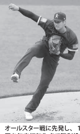
オールスター戦に先発し、1回を無安打無失点で勝利投手になったエンゼルスの大谷(右)。デンバー

【デンバー共同】松下裕(ファンが待ちわびた「SHO TIME」)は4日目で初めて選ばれたオールスターに投げた。大谷は「多量に投げたが、指先が痛んだ」と述べ、指揮系統などで苦戦した。北朝鮮のコロナウイルスをめぐり、米豪両国が一体運用できていると強調した。