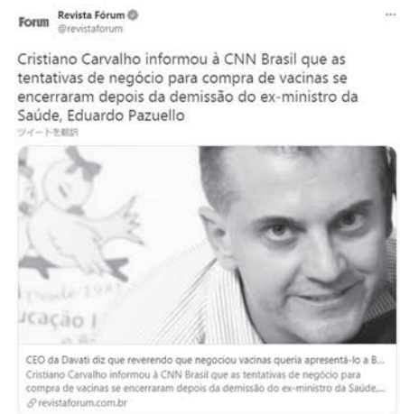
クリスチアーノ氏 (twitter)