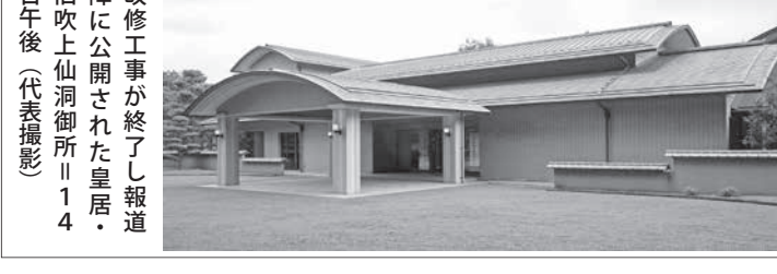
改修工事が完了した皇居・旧吹上仙洞御所。14日午後

【共同】静岡県熱海市の伊豆山の大規模土石流の起点となった土地に盛り土をした神奈川県小田原市の不動産管理会社(清算)が2007年、熱海市内の別の所有地で起きた土砂崩落を巡って市との間でトラブルになり、直後の市議会で市幹部が同社について「ちやうど普通の民間会社ではない」と答弁していたこと