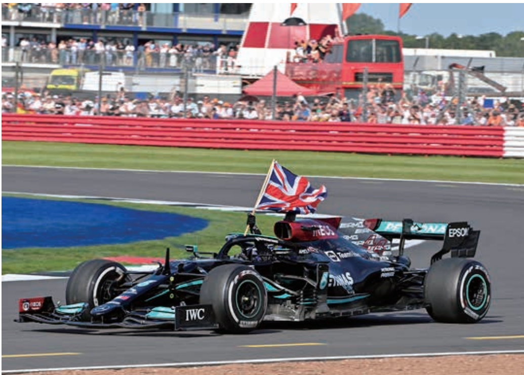
Com o resultado Lewis Hamilton acumula 99 vitórias na F-1.

F1のルイス・ハミルトンがイングランドで8回目の勝利を収め、年間ランキングで首位フェルスタッペンに迫る