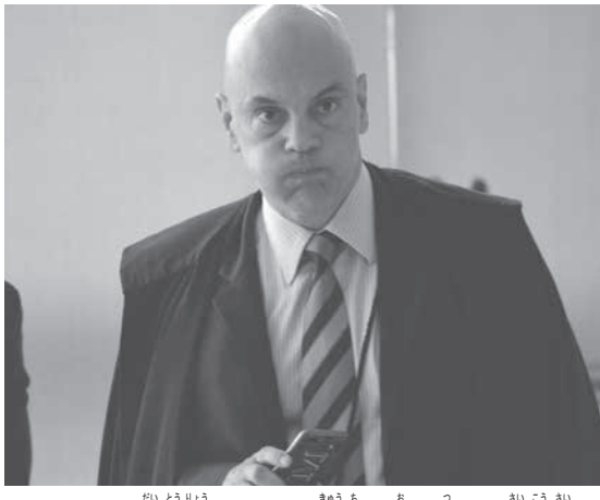
ボルソナロ大統領をどんでん返すに追い詰める最高裁のアレシャンドレ・デ・モラエス判事

「選挙高裁」で4件、最高裁で4件もの捜査が開始されている。これが意味するものは「出馬不可になってもおかしくない」という状況だ。