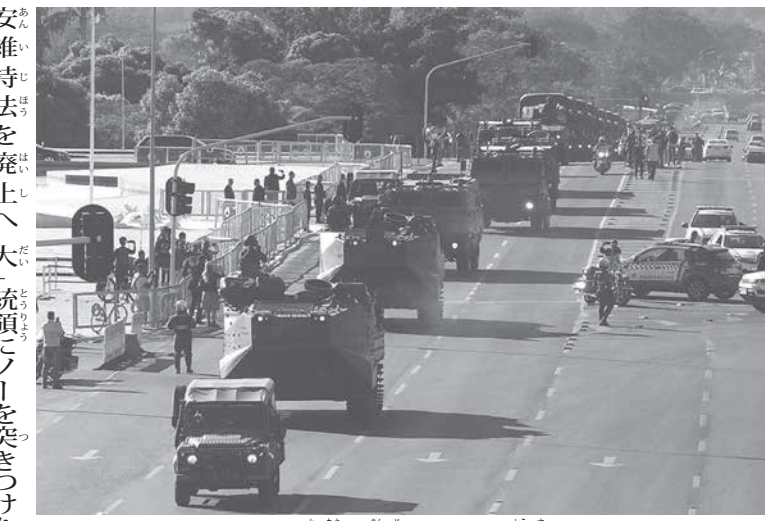
10日朝の軍事パレードの様子

「選挙高裁」で4件、最高裁で4件もの捜査が開始されている。これが意味するものは「出馬不可になってもおかしくない」という状況だ。