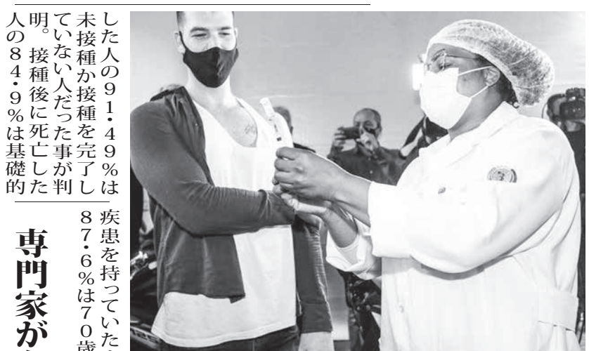
市議や報道関係者らが見守る中で接種を受ける若者