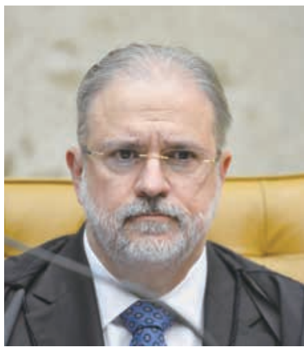
アラス長官