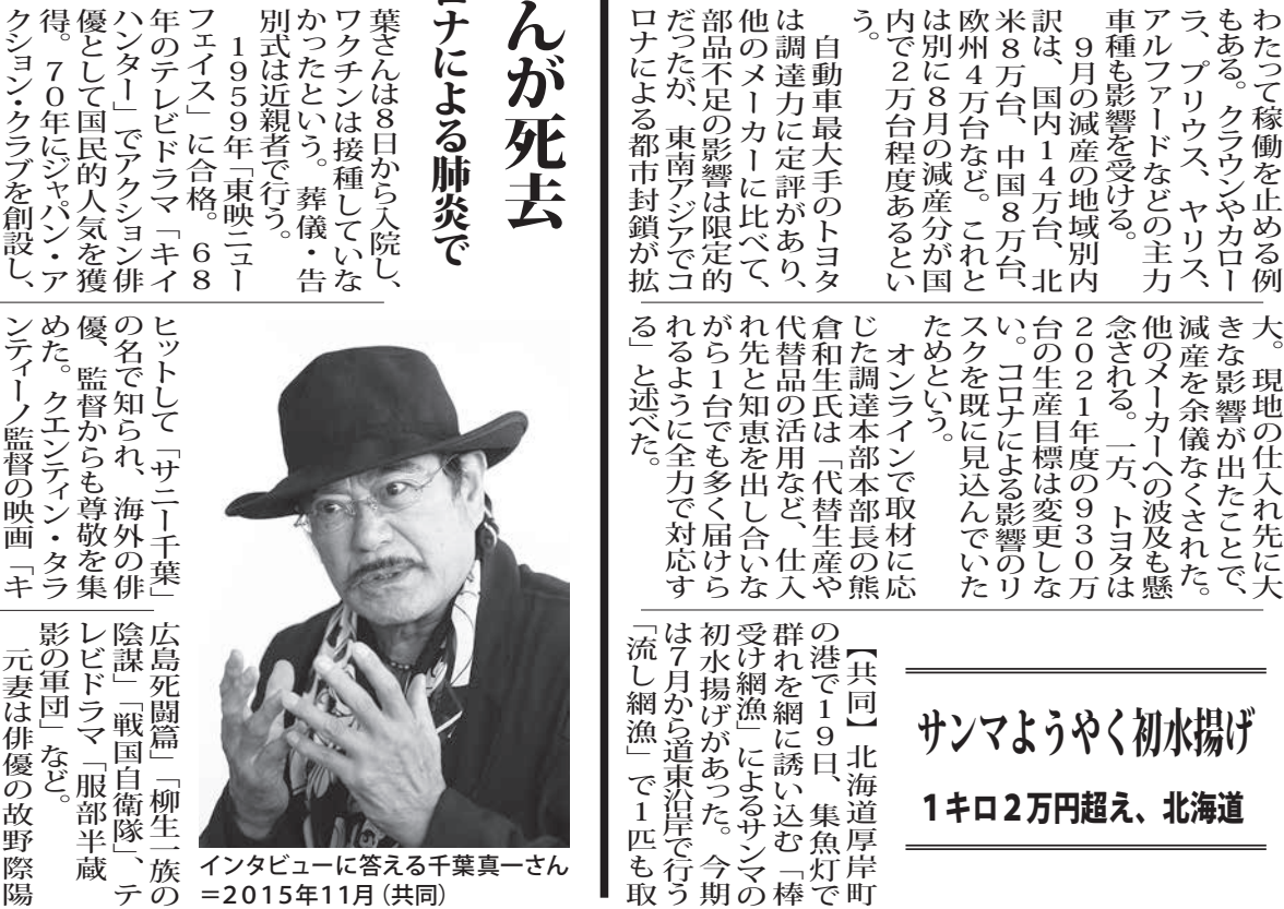
インタビューに答える千葉真一さん =2015年11月

【共同】北海道厚岸町の港で19日、集魚灯で調った報告もあり、過去最低だった昨年より期待できそうと話す。 水揚げされたのは、12日に出漁した19トンの小型船1隻が約1200キログラム離れた公海で2日間、棒受け網漁で取ったサマ。1匹100グラム前後とやや小ぶりという。 19日は午前7時半に競りが始まり、競り人や買い受け人の威勢の良い掛け声が響いた。水揚げ量の約半分を最高値で競り落とす地元水産会社は「内海陸人社長(53)は「ようやくサマの季節だ。全国の消費者に届けたい」と意気込んだ。 競り後、町内の鮮魚店に並んだサマには1匹3500円(税抜き)の値札が付けられ、店を訪れた男性(75)は「祝儀相場とはいえ、高くても手が出せない」と驚いていた。