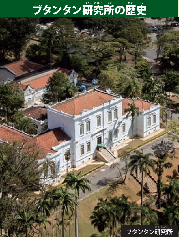
ブタンタン研究所