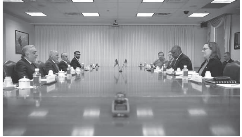
6月25日に米ホワイトハウスで開催されたアフガン撤退に関する首脳会議の様子

「シェール革命」で中東の重要性が低下 09年、オバマさんが大統領になりました。そのころ、アメリカで「シェール革命」が起こりました。