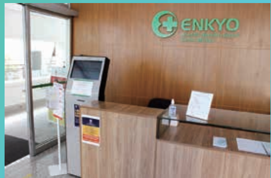
リベルダーデ医療センター受付に設置されている消毒液