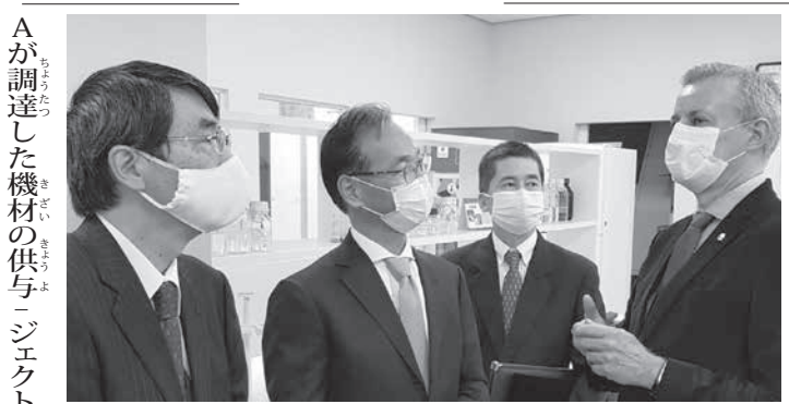
同病院と千葉大学が共同で実施している「ブラジルと日本の薬剤耐性を含む真菌感染症診断に関する研究」とフェレンス

「ブラジルには世界最大の日系社会があるのは皆さんご存知だと思いますが、どんな風にイメージしていますか?」 「世界最大の日系人コミュニティの実像」440カ所のリアルボイス(本当面都市部では「日系社会」は見えず、な