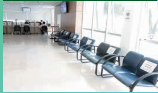
リベルダーデ医療センター待合室でのソーシャル・ディスタンス