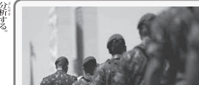
「軍や警察が最後の砦か?」

「ブラジルには世界最大の日系社会があるのは皆さんご存知だと思いますが、どんな風にイメージしていますか?」 「世界最大の日系人コミュニティの実像」440カ所のリアルボイス(本当面都市部では「日系社会」は見えず、な