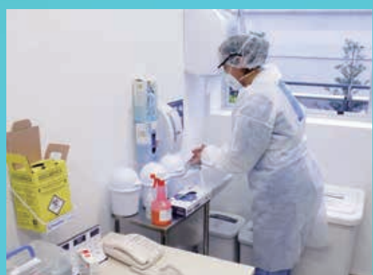
徹底させている手洗いや消毒液の使用