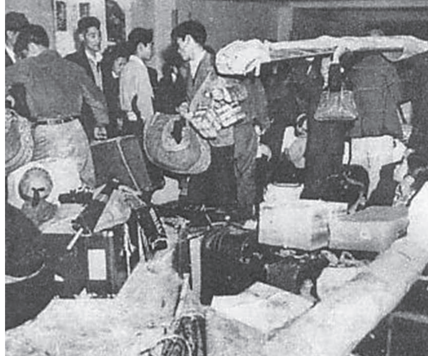
ボリビア移民団の様子 (Unknown author/Unknown author, Public domain, via Wikimedia Commons)

「コロニア・オキナワ」は、当初は陸稲栽培を主軸に営農が行われ、裏作にはトウモロコシを植えた。一時は「アロウスオキナワ」として有名になるが、陸稲の単作営農は様々な弊害が発生して後退、70年代からは綿花が基幹作物として定着している人々にとっては、一日中誰かが水汲み担当で働くというつらい日々であった。 蚊の大群にもまた困る日々であった。夏の暑い日には、びりびりするほどの蚊が襲ってくるため、労働している間もジャンパーなどを着込んで厚着せねばならず、道をゆく時は木の枝で蚊を追い払いながら歩いた。 来客がある時は家中煙をたいて、足をばたばた動かしながら話をせねばならなかった。食事を