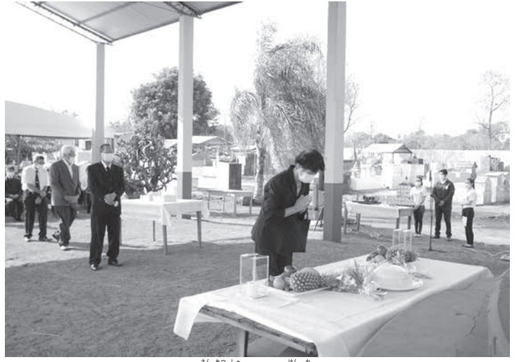
参列者による献花

人會に移管された。日墓地的かないので、一般の系移住地から始まったイグアス市には現在1万2千人が在住、この