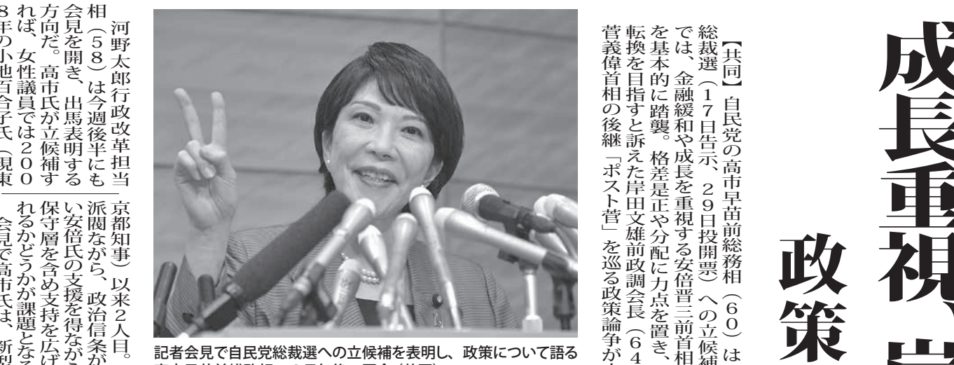
記者会見で自民党総裁選への立候補を表明し、政策について語る高市早苗前総務相=8日午後、国会