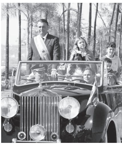
7日のボルソナロ大統領