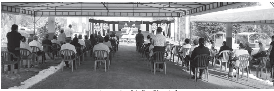
後ろから見た慰霊祭の会場の様子