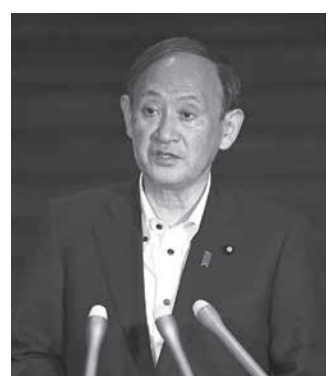
菅首相=8日午後、首相官邸

菅首相は8日午後、首相官邸で記者会見を行い、緊急事態宣言の延長について「（共同）政府が緊急事態宣言の発令されている地域などでも行動制限を緩和する案をまとめる」と述べた。