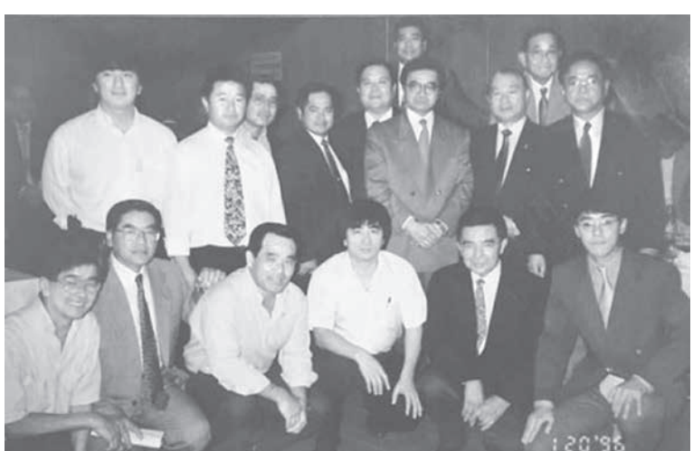
ボリビア親睦会の仲間たち

だが、明けて10月に突然原因不明の熱病が発生、55年4月までに多くの人が亡くなった。「うるま病」と呼ばれた病気で、原因不明のこの熱病は、40度近い高熱が数日続き突然容態が悪化し死亡に至り、しかも働き盛りの若者を襲う脅威の伝染病であった。それに加え、ランデ河の増水による大洪水、そこから逃げた大群が移住者の家の中に群がり衣食を食い荒らす被害に襲われた。 移住者たちは、進退窮まる深刻な事態に直面した。うるま病は、全移住者大会を開催し、一刻も早い新たな移住地への移転を決定した。 そして同年8月にパロメティア河河畔に移転。さらに慎重な踏査の結果、現在のロス・チャコス村付近に再移転したのである。 ここに第1コロニアが建設され、1956年10月には全員移動が完了した。 沖繩を出発してから2年有半の移住地定着の悪戦苦闘、そしてまた水や食料も満足にない入植地の苦勞。その逆境に堪えながら移住先人たちが、第1コロニア建設のために原始林開拓の斧を振るったのである。 そのエネルギーと団結心は、世界各地の日本人移民史の中でも希有のものである。このコロニア・オキナワは、その後も生活用