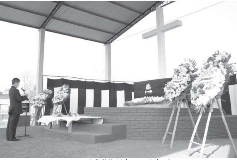
イグアス日本人会会長による追悼の辞

最後に参列者が一人ひとりを花を渡し、静かに手を合わせた。 1時間ほどで慰霊祭は終わったが、同墓地は終日参列者のために開放され、日没までに数十人の献花が供えられていた。 移住地入植初年に日本人の子どもが亡くなったことから、60年前にこの墓地も作られた。当初はJICAが管理していたが、その後、日本の