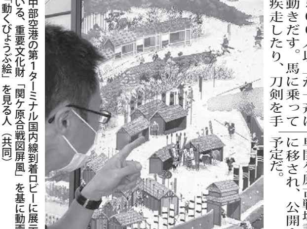
中部空港の第1ターミナル国内線到着ロビーに展示されて...