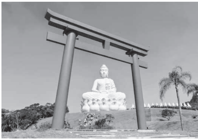
仏教の仏像と神道の鳥居という有る意味ブラジルらしい佇まい

「エスピリトサント州に巨大な大仏ができたらしい」突然、本紙読者からそんな問い合わせの電話があった。調べてみると、大仏は州都ワイリア市から高速道路BR-101号線を北進した先の人口約1万2千人ほどのイラス市に建てられていた。大仏は101号高速道路沿いにある鳥居公園(Praca do Torii)内に作られ、台座を含めると35メートル、重さは350トンもある。奈良の大仏は高さ15メートルで重さ400トン、鎌倉の大仏は12.4メートルで120トン。リオ市コルゴボアの丘のキリスト像は高さ30メートルなので、それを超える大きさだ。さっそくお寺を探し、住職に話を聞いてみた。