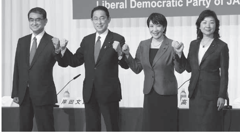
自民党総裁選候補者の共同記者会見を前に、ポーズをとる(左から)河野行幸相...