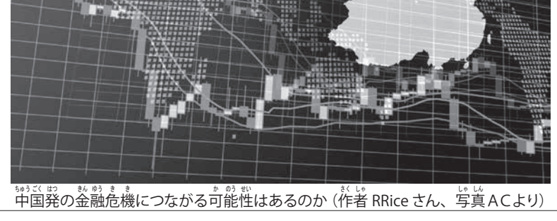
中国発の金融危機につながる可能性はあるのか

恒大は、習近平の中共による経営破綻に追い込まれている。中共は恒大だけでなく民間不動産会社の全体を潰しにかかっている。