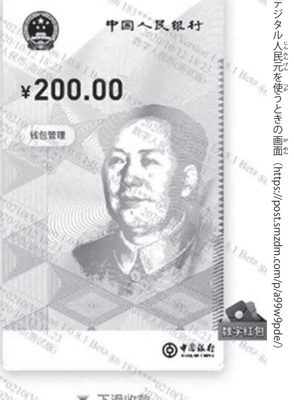
デジタル人民元を使う画面 (https://posts.mzdm.com/p/99w9pde/)

恒大は、習近平の中共による経営破綻に追い込まれている。中共は恒大だけでなく民間不動産会社の全体を潰しにかかっている。