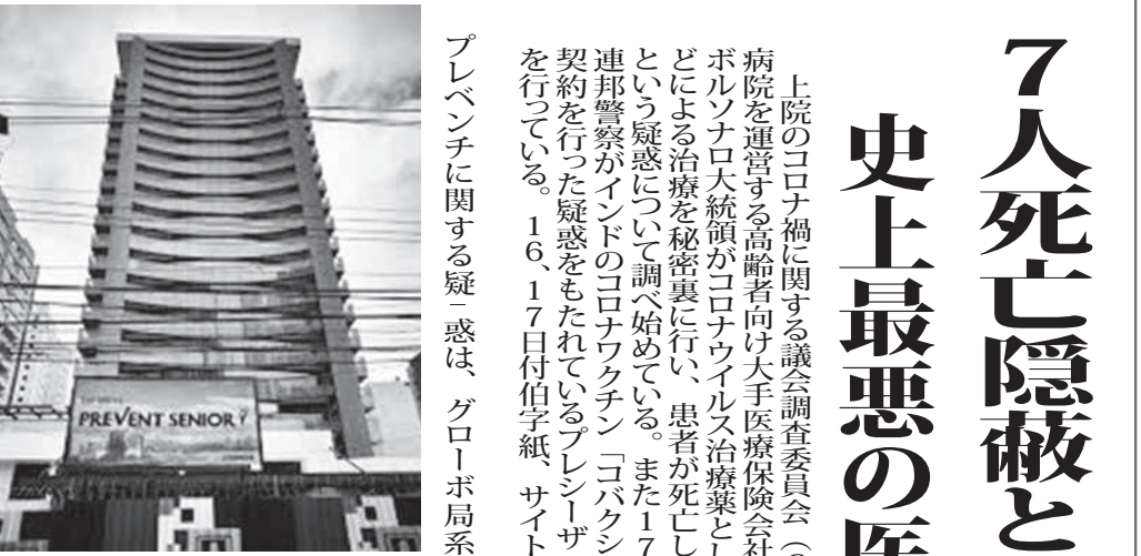
プレベンチの本部 (facebook)