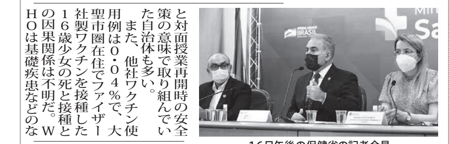
16日午後保健省の記者会見