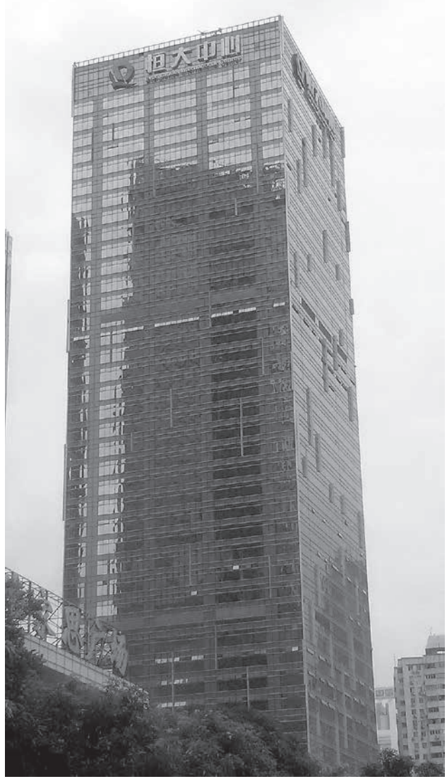
恒大集団(英語: Evergrande Group)の本社ビル。中華人民共和国広東省深圳市に本拠を置く(登記上の本拠地はケイマン諸島)不動産開発会社。創業者の許家印(中国語版)はフォーブスによれば2019年3月時点で362億ドルの資産を有し、世界22位、中国3位の富豪とされる。同族経営で2009年の「グローバル・ファミリー企業500社ランキング」で25位にランクインした

中国の最大級の不動産会社である恒大集団(エバークラウド)が倒産に向かっている。恒大は9月8日に債券を格下げされ、それまでの経営難が倒産への道と事