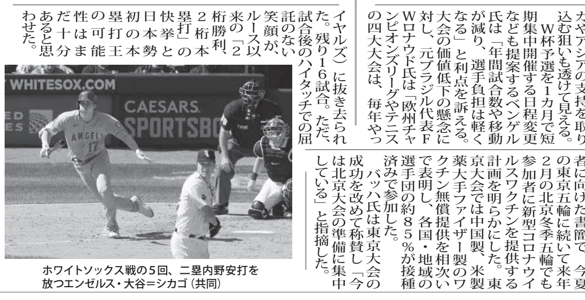
大谷(右)が打棒に光。=シカゴホワイトソックス戦の5回、二塁内野安打を放つエンゼルス・大谷

【シカゴ共同】松本裕樹(エンゼルス)の大谷は、右腕に痛みを覚えず、予定の登板を回避することがどう見ても必要がある。大谷は9試合ぶりに複数安打をマークした。