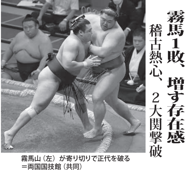
霧馬山(左)が寄り切りで正代を破る。=両国国技館

大谷、9試合ぶり複数安打 登板回避の中、打棒に光 大谷は9試合ぶりに複数安打をマークした。登板回避の中、打棒に光。大谷は9試合ぶりに複数安打をマークした。