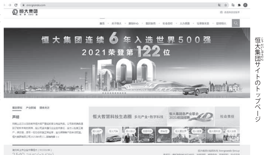
恒大集団サイトのトップページ

恒大は、習近平の中共による経営破綻に追い込まれている。中共は恒大だけでなく民間不動産会社の全体を潰しにかかっている。