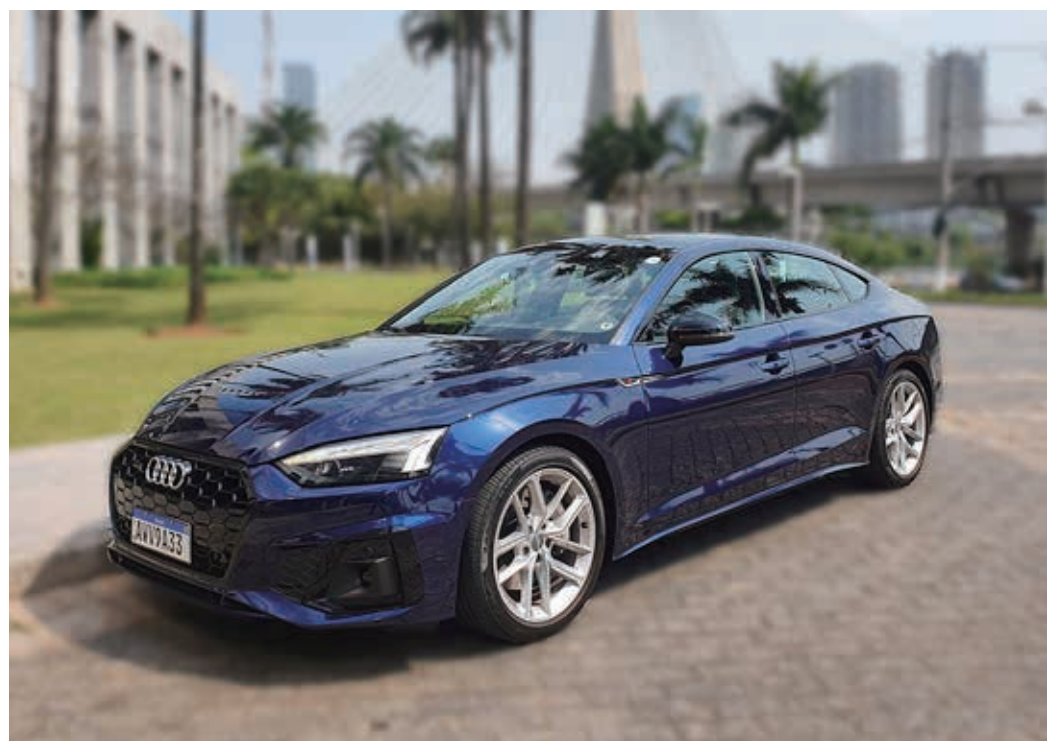
Audi A5 Sportback tem preço de R$ 307.990,00 na versão Prestige Plus e R$ 379.990,00 na versão Performance Black.

A Audi trouxe para o Brasil no primeiro trimestre de 2021, o novo A5 Sportback, com visual renovado e como itens de série o controle de cruzeiro adaptativo, faróis dianteiros LED Matrix e display com tela sensível ao toque de 10,1 polegadas.