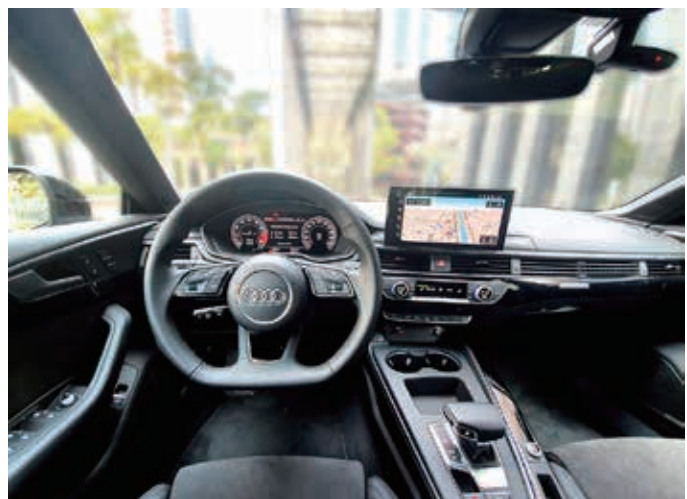
Painel de instrumentos digital Audi Virtual Cockpit Plus de 12,3 polegadas configurável.

Andando com o carro dá para entender porque a marca é sinônimo de alta tecnologia, onde mecânica de