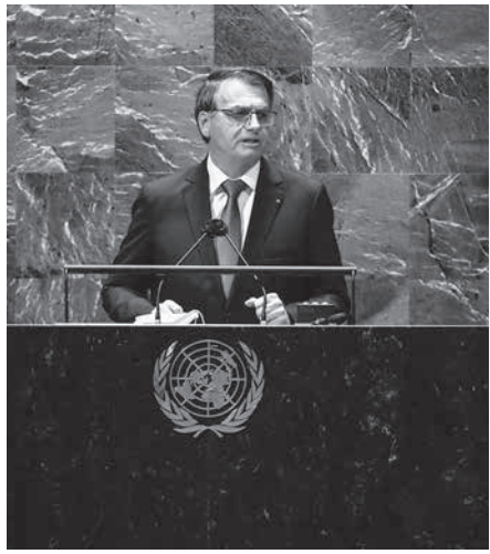
連日のボルソナロ大統領