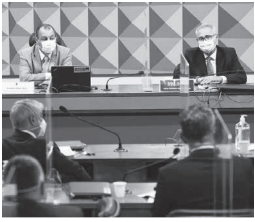
コロナ禍CPI

上院のコロナ禍調査委員会(CPI)は今週も、クロロキンの不正治療とそれに伴う死者の隠蔽疑惑に揺れる高齢者向けの大手保険会社プレベンチ・セニオールに関する捜査を進める。28日には「プレベンチ側が疑惑を告発する文書の作成に関係した医師を解雇するなど、不正行為に出た」とする弁護士などが召喚される。27日付付付紙「サイト」などが報じている。