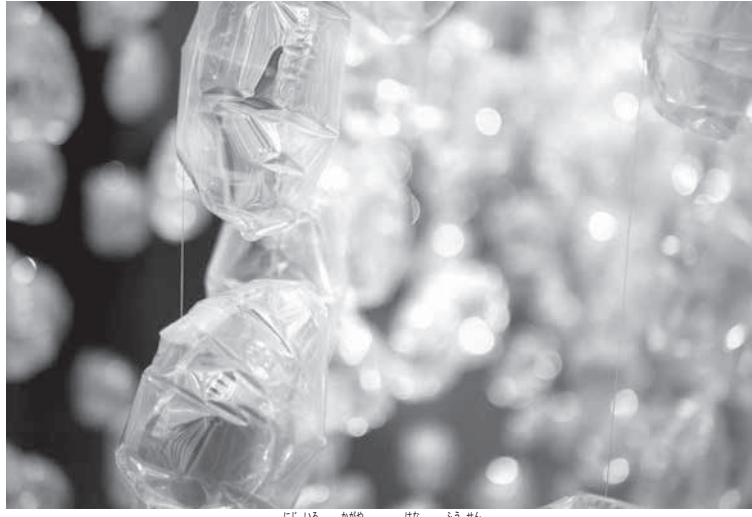
虹色の輝きを放つ風船

志さんによる同ユニットの作品展の開催は南米では初めて。同展で展示される作品は幅1メートル、高さ3メートルに及ぶ大型インスタレーションで、使用される風船は九千個以上。使用される風船の数のために横浜風船株式会社と共同開発されたものを使用しているという。