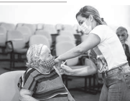
マカパ市での高齢者への補強接種

た。このため、3月は2度増加を見たものの、死者は12週間連続で減少を記録した。だが、9月12〜18日(感染学上第37週)は感染者、死者共に前週比で増加を記録。19日(感染学上第38週)の感染者は1万2979人、死者は3692人で、前週比では減少したが、第36週(6月20〜26日(感染学上第25週))から9月5〜11日(感染学上第36週)までの2週間平均5844人を和に7日のデモや連休の