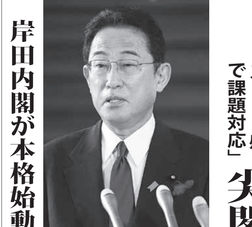
記者団の質問に答える岸田首相=5日午前、首相官邸

【共同】岸田文雄内閣の各閣僚は5日、組閣から1日遅れで就任記者会見に臨んだ。萩生田光一経済産業相は、温室効果ガスの排出削減目標に総力を挙げて取り組む必要性を指摘し「安全最優先で原発再稼働を進める」と話した。小池百合子環境大臣は、10月1日開始の国連気候変動枠組条約第26回締約国会議（COP26）に間に合うよう、関係省庁に指示を出した。山口組環境相は、エネルギー基本計画に盛り込まれ