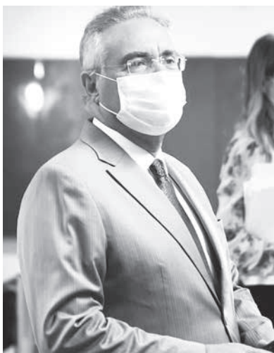
レナン上議