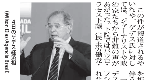
4日のゲデス経済相

ENKYO 本記事は、日本政府支援事業に基づき、サンパウロ日報協会の実施している「コロナ感染防止キャンペーン」の一環です。