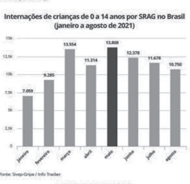
SARSによる0〜14歳の月別入院件数 (4日付G1サイトの記事の一部)