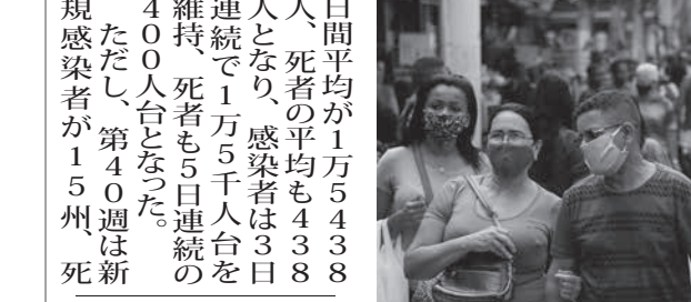
マスクがなければコロナ前と変わらないほど人が増えた街中

伯国の守護者ノッサ・セニョーラ・アパレシダの日にあわせて、聖州のアパレシダ聖堂を目指して巡礼する信者が、新型コロナウイルスによるパンデミック前を上回るといわれる11日、同州の主要な巡礼路を歩いた。巡礼者は、感染回復と守りに感謝して、街歩きをした。