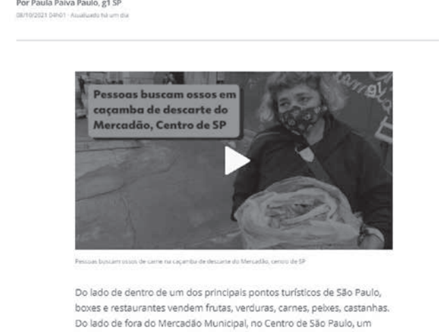
Do lado de dentro de um dos principais pontos turísticos de São Paulo, boxes e restaurantes vendem frutas, verduras, carnes, peixes, castanhas. Do lado de fora do Mercado Municipal, no Centro de São Paulo, um flagrante da luta contra a fome: pessoas buscando ossos de carne na caçamba de descarte.

10月8日付G1サイト「聖市セントロの市場の生ゴミ捨て場に廃棄された骨をあさる人々」の記事の一部 (10月9日参照)