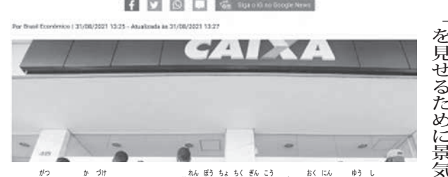
9月14日付igサイト「連邦貯蓄銀行が1億人に融資を開始する予定」(9月14日参照)

「アウシリオ・ブラジルの審議に時間がかかる中、開始までの時間稼ぎにこの融資を貧困層に行うのでは」と言われている。いくら国営銀行でもこんなバラマキが許されるとは信じがたい。