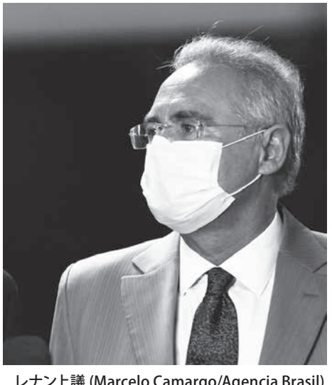
レナン上議