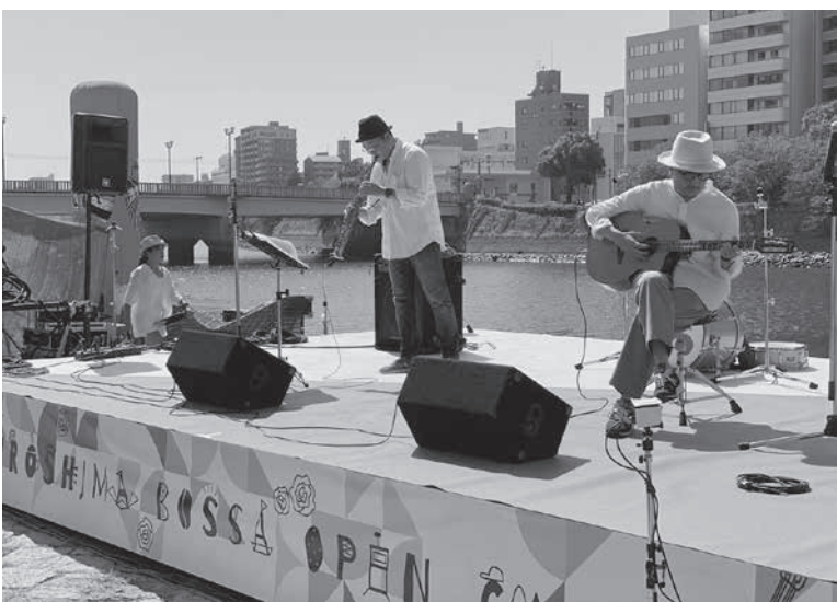
バックを川にしたブラジルカラーのステージ

原爆投下の目標地点となった橋のたもとから、ブラジルを通じた新たな平和の形を。広島市中区の平和公園近くの河岸で3日、新たな国際平和イベント「Hiroshima Bossa Open Cafe」が開かれた。ブラジルと広島のゆかりを背景に、音楽や文化を発信する「J」が目的。市民団体「River Do」基町川辺コンソーシアム」が主催した。広島日伯協会後援。