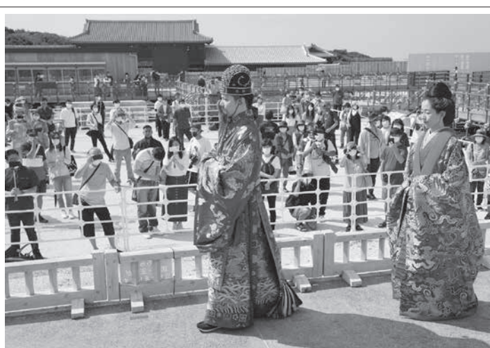
首里城復興祭に登場した国王と王妃役=30日午後、那覇市の首里城公園

王氏は台湾の「平和的... な統一」も強調。武力行... 使を懸念する国際社会を... 意識した最近の抑制的な... 発言の一環とみられる。