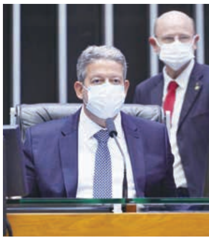
3日のリラ下院議長

アウシリオ400レに前進 P.D.T.の方針転換決め手に 3日、下院でブレカトリオ(裁判所が連邦政府に命じた賠償金などの支払い方法に関する憲法改正法案(P.E.C.))の審議と初回投票が行われ、4日未明に骨組みとなる本文が承認された。だが、3分の2をわずかに上回る賛成票に留まり、民主労働党(P.D.T.)も賛成票を投じたため、同党の大統領候補のシロ・ゴメス氏が、大統領選候補を降りると抗議を行うなど波乱含みのものとなっている。4日付付字紙、サイトが報じている。 シロが激怒し大統領候補降る ブレカトリオのP.E.C.は、ボルソナロ大統領が進める新社会保障プログラム「アウシリオ・ブラジル」の財務確保のためにも、連邦政府にとっては是非でも通したいものだった。プログラム自体は連邦政府が10月末に11月から実施と宣言。当時は「ボルソナ・ファミリー」の平均支給額189レアルを222レアルにあげた形で17日