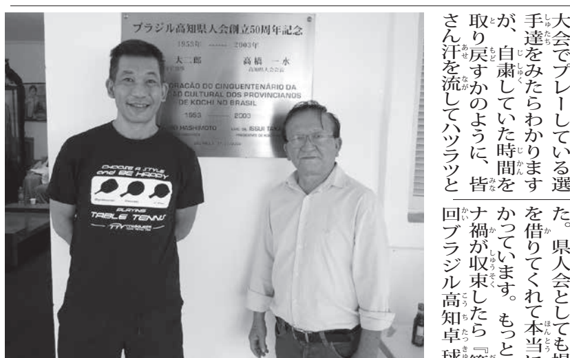
左からマキウチ会長と片山会長