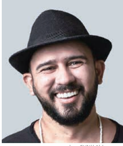
ブラウリオ・ベッサ氏

ベッサ氏は、テレビ、ラジオの番組「エンコントロ・コン・ファッチマ・ベルナルデス」にレギュラー出演して以来、ブラジル国中で広く知られるようになった詩人だ。現在、インスタグラムやフェイスブックなどのSNSでフォロワー総数は約500万人にのぼり、「ポルデステ」(ブラジル北東部)の異名を持つ。ベッサ氏は1986年、セララ州アウト・サントで生まれた。14歳の時に、地元公立学校の国語教師を通して出会ったパタチーバ・ド・アサレの詩に大きな感銘を受け、詩人になる決意をした。「パタチーバ・ド・アサ