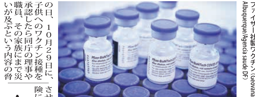
ファイザー社製ワクチン

米国もファイザー社製で開始 アメリカ疾病予防管理センター(CDC)が2日に5〜11歳児へのファイザー社製ワクチンの適用を勧める判断を下した事で、米国では3日から子供向けの接種が始まった。だが、伯国では同年齢層の子供向けのワクチン接種承認を阻もうとする人物が国家衛生監督庁(Anvisa)に脅迫状を送りつける事件も発生し、10月30日、11月3日付付字紙、サイトが報じた。 子供への新型コロナワクチンの接種は大人への接種がある程度進んだ国で始まっており、3日からは米国もその一端に加わった。予防接種が新型コロナの感染拡大抑制に不可欠である事を認める国や自治体は、社会全体の免疫力を高め、子供への接種を望んでいる。 一例は聖州で、コロナ対策の担当者達はAnvisaの許可が出次第、子供への接種を開始する意向を表明。ドリア知事も3日、チリやアルゼンチン、コロンビアでは始まっているとして、同庁