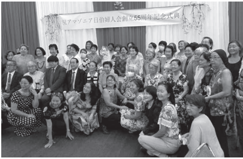
出席した婦人会の皆さん

【ベレン州発】州都ベレンの町では、コロナの規制も緩和され、様々な催しが活動を始めています。その中で10月26日には、日系社会でも記念すべき式典が開催されました。1966年10月に創立された、アマゾンニア日伯婦人会の55周年を記念する式典である。会場の汎アマゾンニア日伯協会神内講堂には、60人程の会員や招待者が参加していた。