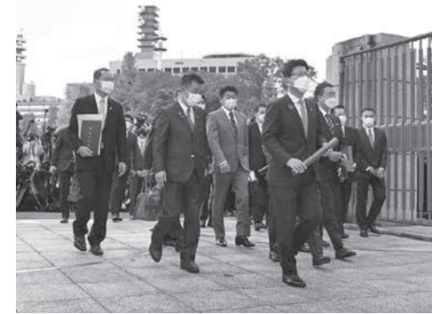
新人議員、緊張の初登壇

【共同】衆院選を受けた第206特別国会は10日召集され、岸田文雄首相(64)が衆議院の首相指名選挙で第101代首相に選出された。首相は皇居での首相任命式と閣僚証式を経て、公明党との連立による第2次岸田内閣を10日夜発足させた。今後、新型コロナウイルス経済対策を19日に閣議決定し、2021年度補正予算案と22年度予算案の編成作業を加速させる。記者会見で「まずは経済を成長させる」として、成長のための投資と改革を推進すると表明。防衛力強化への意欲も示した。