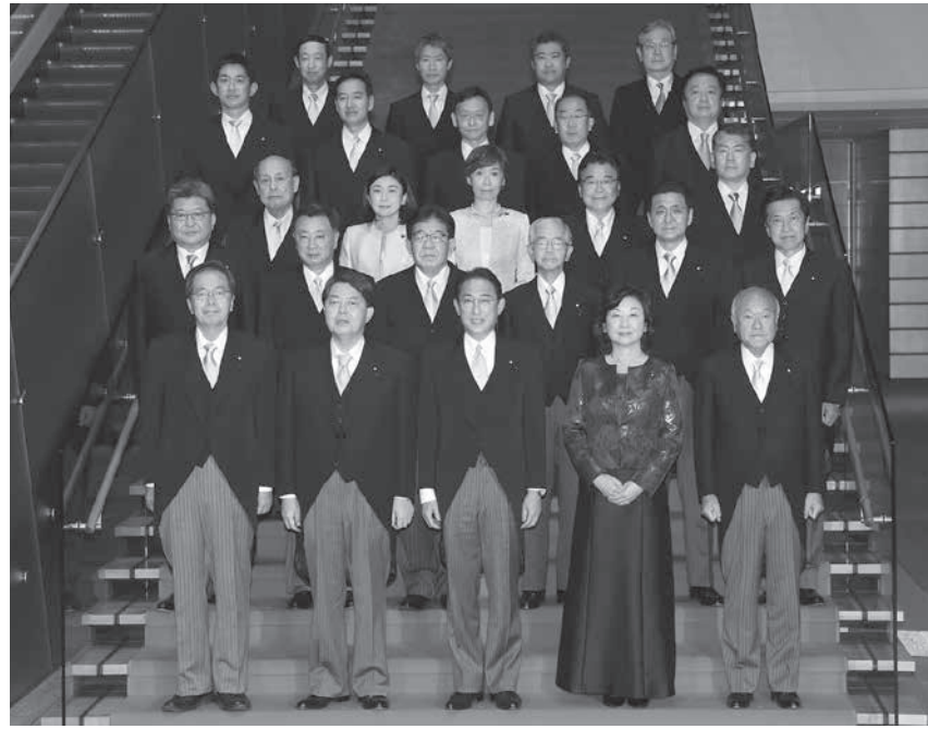
初閣議を終え、記念写真に納まる岸田文雄首相 (前列中央) と閣僚ら= 10日午後10時38分、首相官邸