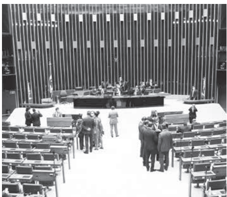
9日の下院での投票