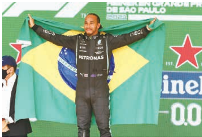
O inglês heptacampeão Lewis Hamilton (36) da Mercedes conquistou a sua 101ª vitória na F-1.

Max Verstappen - Largou na segunda posição, mas tomou a ponta de Valtteri Bottas da Mercedes na largada mantendo a liderança até 60ª volta. O holandês fez de tudo para se manter à frente de Hamilton a ponto de ser advertido com uma bandeira branca e preta por ficar zigzagueando na frente do inglês para bloquear a ultrapassagem. Contudo, o talento de Hamilton e a maior velocidade da Mercedes nas retas fizeram com que o holandês se contentasse com o