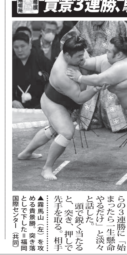
大相撲番付表(共同)

【共同】米大リーグ、エンゼルス投手の大谷翔平(27)が、15日、東京都市野球場で記者会見を行った。大谷翔平は、史上初の最年少で四冠を達成し、新王となる竜王を奪取した。