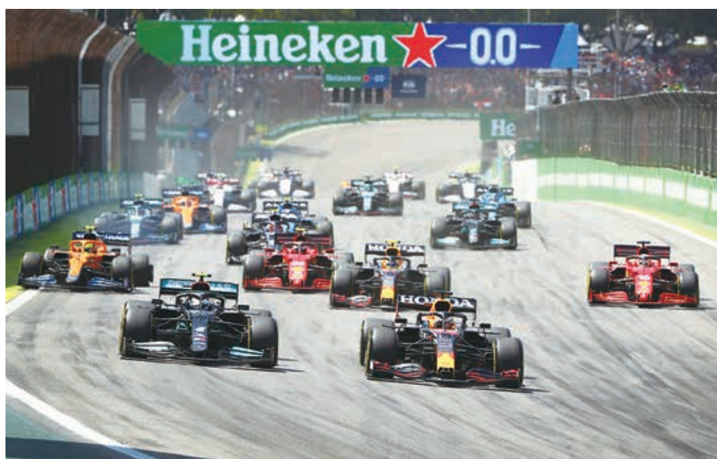
Na largada do Grande Prêmio de São Paulo de F-1, Max Verstappen da Red Bull Honda toma a ponta após a primeira curva.

Corrida em Interlagos teve recorde histórico de público com 181.711 pessoas nos três dias.