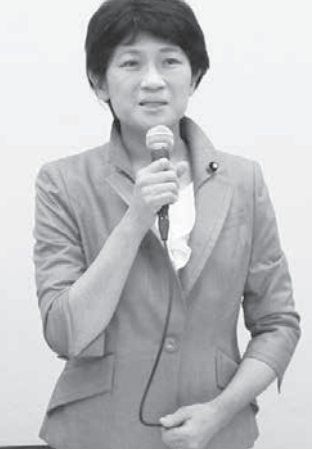
立憲民主党代表選への立候補を表明した西村智奈美元厚生労働副大臣

【共同】立憲民主党の代表選が19日告示される。新たに西村智奈美元厚生労働副大臣(54)と小川淳也元総務政務官(50)が18日、立候補を正式表明した。これまで泉健太郎政調会長(47)と逢坂誠三元首相補佐官(62)が出馬を表明し、4候補が争う選挙戦の構図が固まった。枝野幸男前代表などとの野党共闘の是非や、党の立て直し策が焦点となる見通しだ。衆院選敗北の責任を取って辞任した枝野氏の後任を選挙代表選は、国会議員に加え、地方議員や党員らも投票する。党員参加型で実施する。30日に開かれる臨時党大会で新代表が選出される。西村氏は衆院新潟1区選出で当選6回。国会内で記者団に「新型コロナウイルスの理不尽を減らし、世の中を良くするために党の先頭に立つ」と意欲を語った。17日に決意表明した際は推薦人が足りなかったが、必要な20人の確保にめどが立った。小川氏は衆院香川1区選出で、同じく当選6回。自身の政治活動に密着し