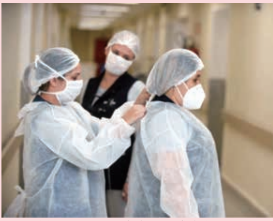
院内で着用されるマスク、防護ネット、防護服