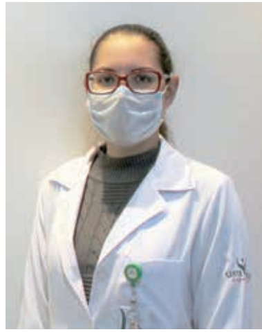
ジョルダナ・マシャード医師