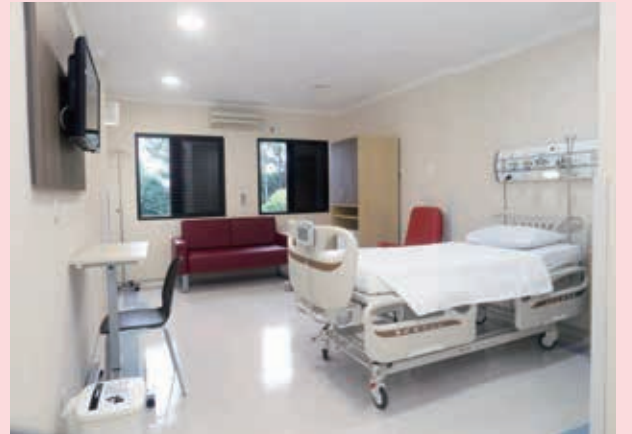
コロナ入院患者の隔離部屋（提供写真）