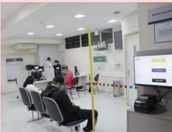
院内の救急施設（提供写真）