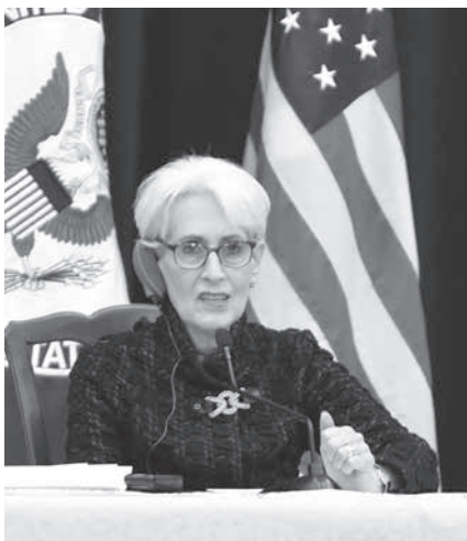
17日、米ワシントンの国務省で記者会見するシャーマン国務副長官

【ワシントン、ソウル共同】日米韓3カ国は米東部時間17日、外務次官協議をワシントンで開き、北朝鮮の核・ミサイル問題などを議論した。協議後に共同記者会見を予定していたが、日本側が韓国の警察庁長官による島根県・竹島(韓国名、独島)上陸を理由に不適切だと来側に伝え、見送られた。森健良外務事務次官は3カ国協議後、韓国の崔鍾建外務第1次官と個別に会談し、「上陸は到底受け入れられない」と抗議した。日本外務省筋が明らかにした。