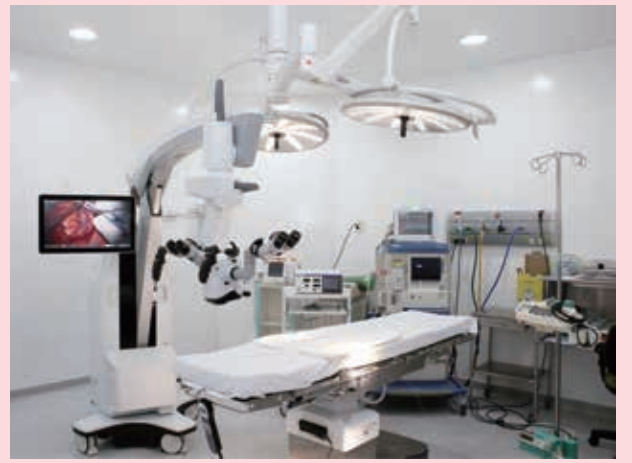
コロナ患者手術センター

「これは、確実にワクチン接種効果による結果です」と断言した。ワクチンは感染そのものを防ぐものではありませんが、重症化を防ぎます。ワクチン接種によって、病院の稼働率も下がりました」と説明する。