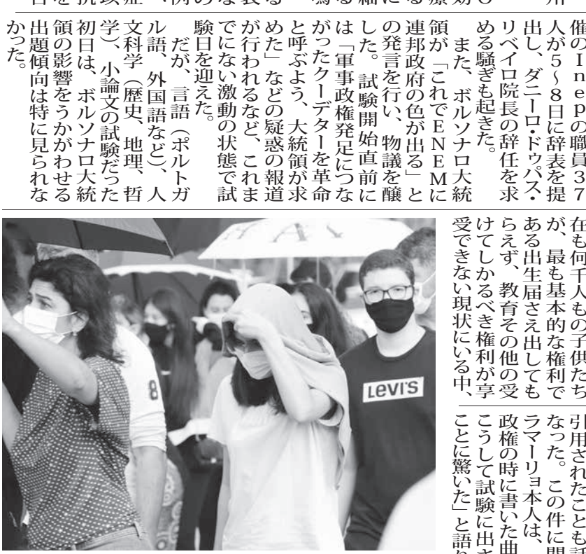
ENEMの受験会場の様子