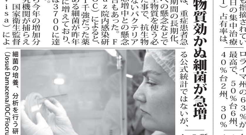
細菌の培養、分析を行う研究員