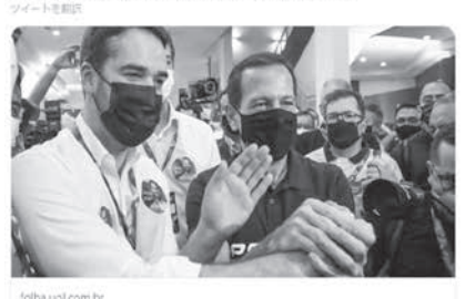
ドリア氏とレイテ氏

21日、民主社会党(PSDB)が、来年の大統領選の公認候補を決める党内選挙を行ったが、専用アプリで不具合が生じ、投票が取りやめになった。投票は不具合が改善され次第、再開となるが、ジョアン・ドリア聖州知事とエドゥアルド・レイテ南大河州知事の争いが激化しているだけに、結果をめぐって党内分裂も起り得る事態となった。21、22日付伯字紙、サイトが報じている。