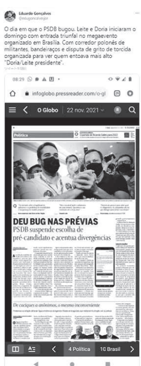
党内投票の混乱を批判する記事 (Twitter)